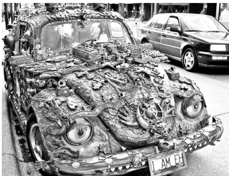
Этот «Жучок» в индийском стиле колесит по Канаде.

кантрой (износостойкой искусственной замшей) соответственно. Замена заводского кресла осуществляется, скорее, из практических соображений. В жестком «ковше», где сидение и спинка соединены, водитель быстро устает. Возможность регулирования угла наклона спинки – не роскошь, а элементарный комфорт. При грамотном подходе автомобиль может стать презентабельней и удобней в эксплуатации. Так, автомобили, рассчитанные на японский и американский рынки, отличаются слабым светом, но это можно поправить. В Мурманске около 30 ма-