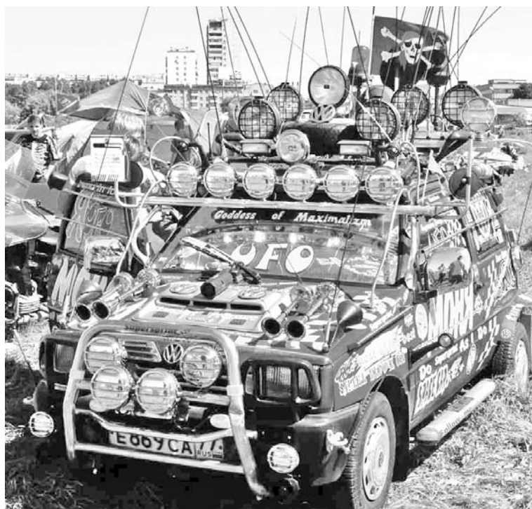
При желании и «Оку» можно превратить во внедорожник.

шин, на которых установлены по четыре спортивные фары и защитная сетка от камней. Никто из владельцев не жалеет об этом.