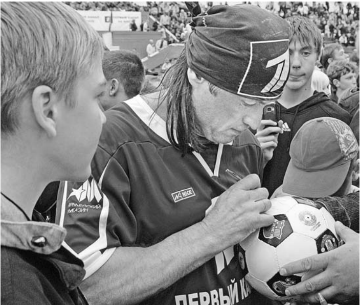
Автограф звезды как напоминание о празднике, который в Северноморске и без того вряд ли забудут.