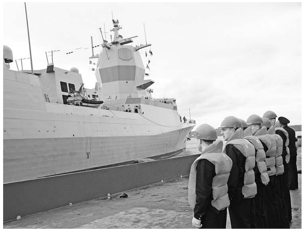
По сравнению с нашими кораблями на фрегате «Отто Свердруп» практически все оружие надежно спрятано от посторонних глаз.