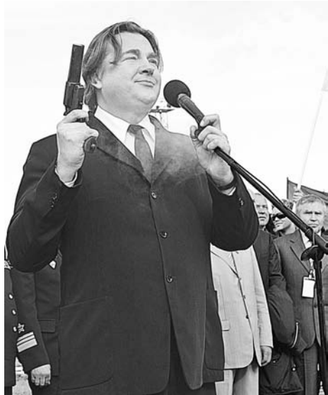
Константин Эрнст: «Акцию «Первый на флоте» объявляю открытой».

Из Первопрестольной - да во флотскую. Первый канал российского телевидения посетил Североморск, а 140 звезд кино и шоу-бизнеса запросто пообщались с военнослужащими и жителями столицы. Только 4 сентября и только на Приморской площади нашего города каждый желающий мог сфотографироваться с Николаем Расторгуевым, взять автограф у Андрея Малахова, поболтать о погоде с Ариной Шараповой и полюбоваться голливудской улыбкой Юрия Николаева. Звезды телеэкрана на расстоянии вытянутой руки! Тринадцатый визит телеканала в войска удался!