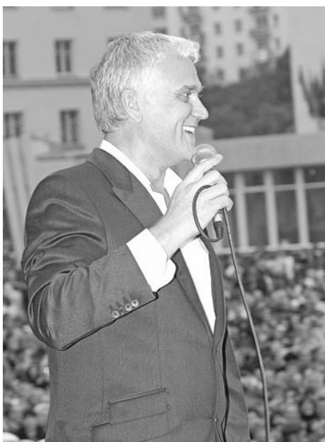
Для Александра Маршала этот приезд во флотскую столицу третий и, надеемся, не последний.

Вечерний концерт на Приморской площади стал финальным аккордом акции «Первый на флоте». Заполненная до отказа площадь красноречиво свидетельствовала об интересе, который вызвала акция у простых горожан. Даже начавшийся во время концерта дождь не разогнал поклонников Александра Маршала, Глюк*Озы, групп «Челси» и «Тутси», Александра Пескова, Владимира Левкина, Виктории Дайнеко, Николая Расторгуева и группы «Любэ».