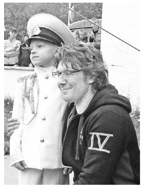
Юные артисты из городских творческих коллективов тоже не прочь сфотографироваться с Андреем Малаховым.