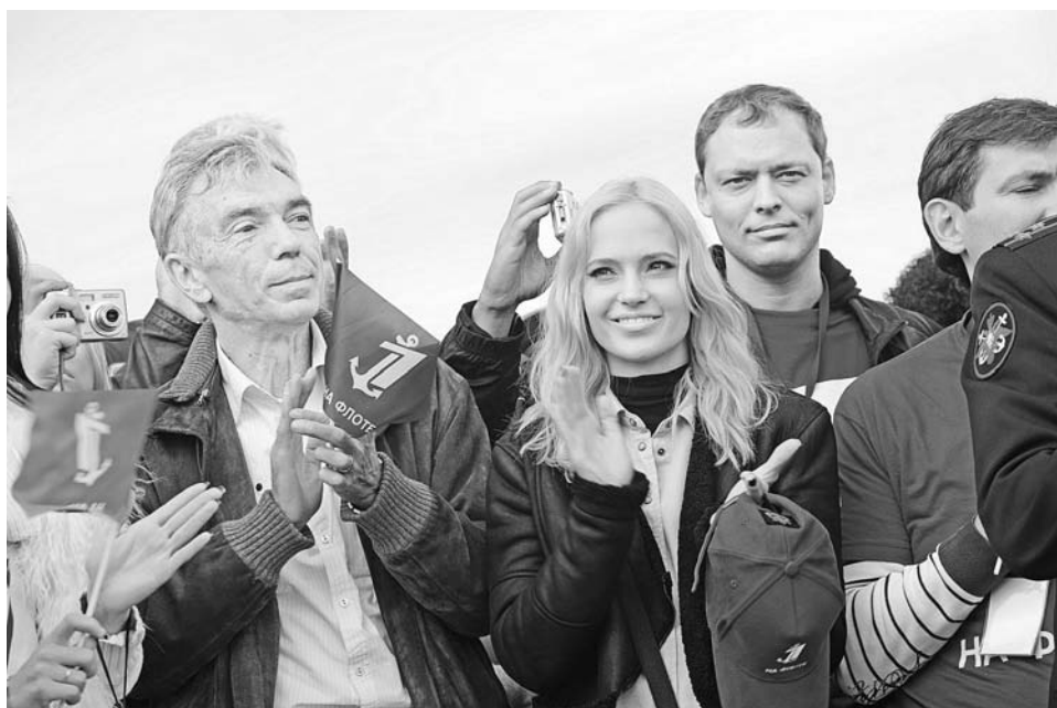
Звездная делегация радовалась встрече не меньше североморцев. Есть надежда, что столичные гости посетят нас еще раз.