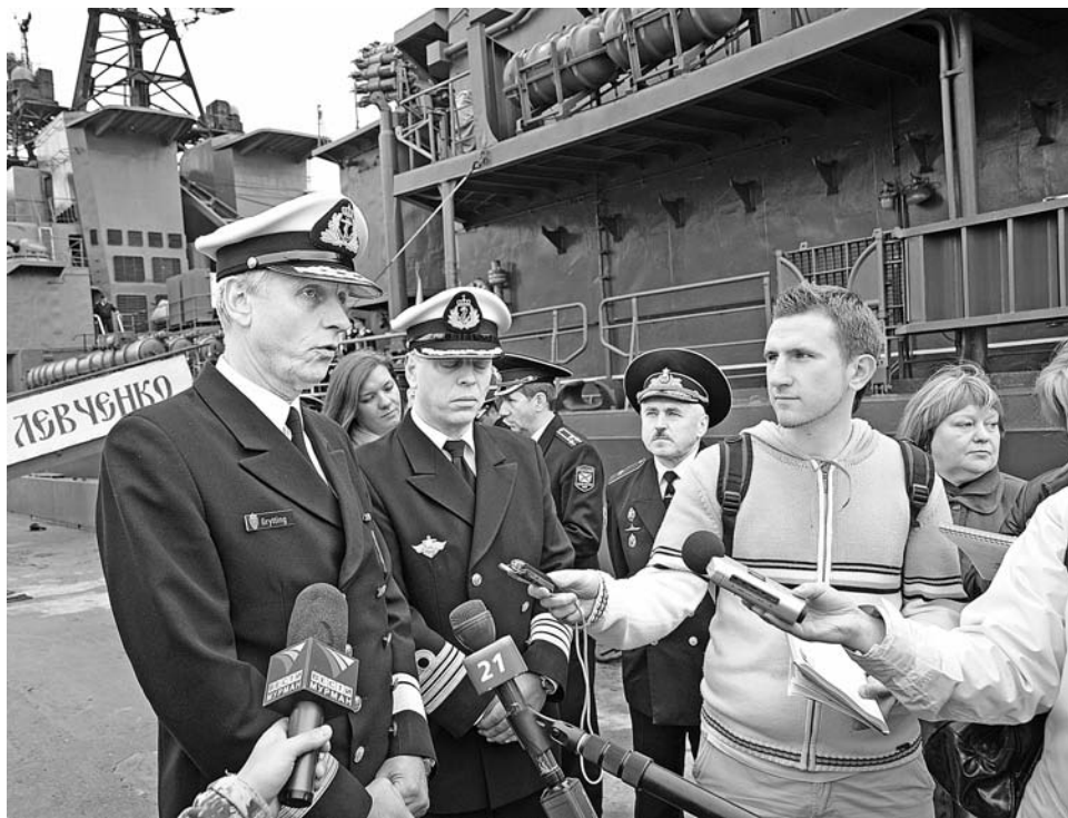
Контр-адмирал Гриттинг: «Во время похода все было хорошо. Спасибо за помощь вашим морякам».