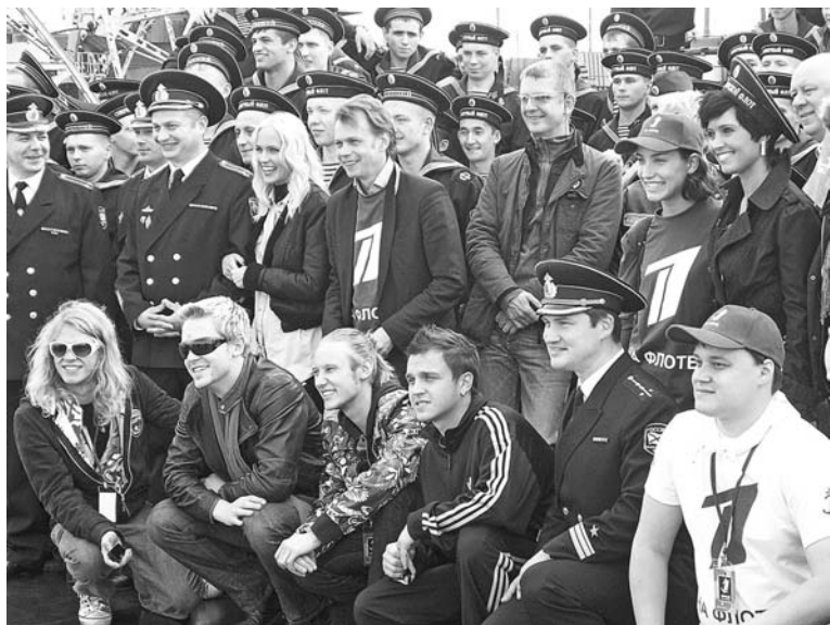
Фотосессия с артистами и телевизионщиками запомнится всему экипажу «Гремящего».

Посмотреть на знаменитостей, а позже и пообщаться с ними, взять автографы и сфотографироваться смогли все желающие, даже матросы, прибывшие на корабль совсем недавно и еще не успевшие принять гвардейскую присягу. Все, кто был в этот день на палубе «Гремящего», ста-