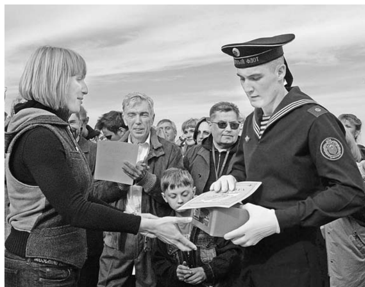
Подарки лучшим морякам из рук Яны Чуриковой.

Московские гости также возложили цветы к памятнику погибшим в годы Великой Отечественной войны североморцам и полюбовались представлением, подготовленным морпехами. Впрочем, и североморцам, привыкшим к подобному рода зрелищам, было чему удивиться: в пролетах над головами зрителей вертолетах можно было разглядеть лица пилотов, а попутно - сфотографироваться в обнимку со смущенной Викторией Дайнеко или