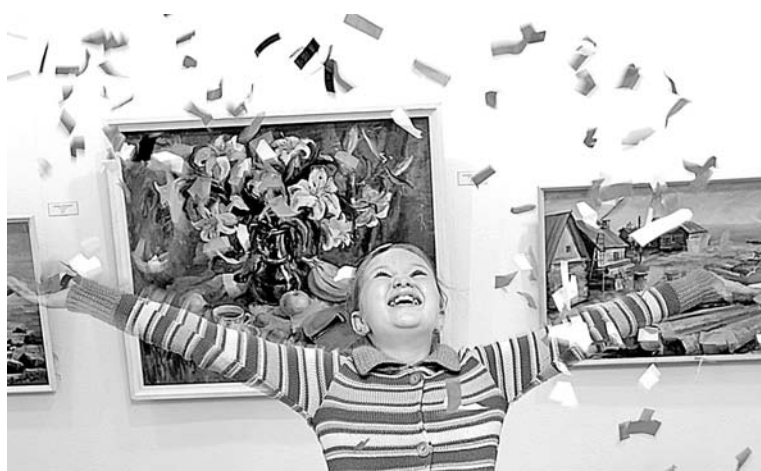
Фейерверк от Городского выставочного зала стал изюминкой открытия вернисажа.