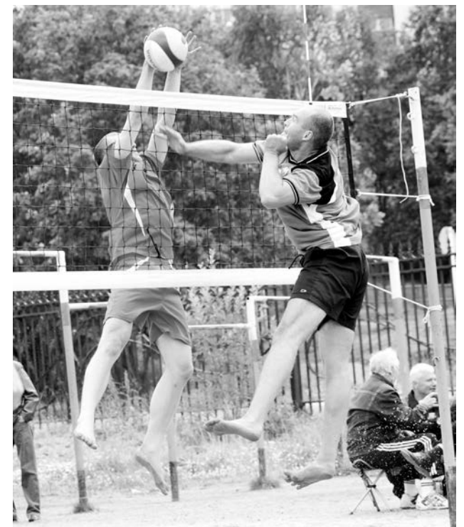
По правилам пляжного волейбола команда состоит из двух человек.

Турнир завершился, как и положено, награждением. Особые аплодисменты – девушкам, которые стали украшением соревнования. Все победительницы – из областного центра и Мурманской области. Команда «Мурманск» стала бронзовым призером, «Судоремонтник» – серебряным, «Олимп» – золотым. Среди мужчин в авангарде оказались североморцы, не дав мурманчанам пробиться к призовым местам. «Бронзу» завоевала пара