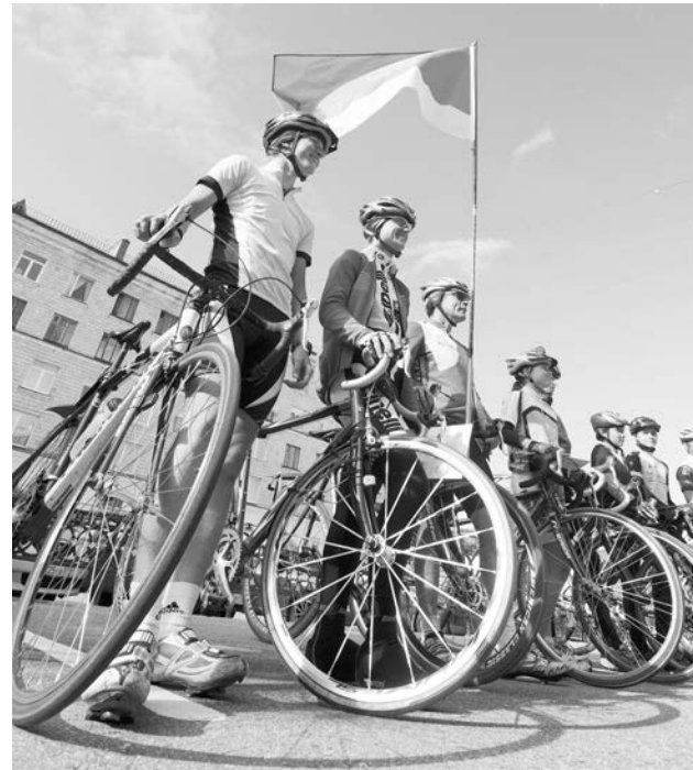
За плечами тысячи километров и десятки городов, а ребята уже готовы к новым путешествиям.