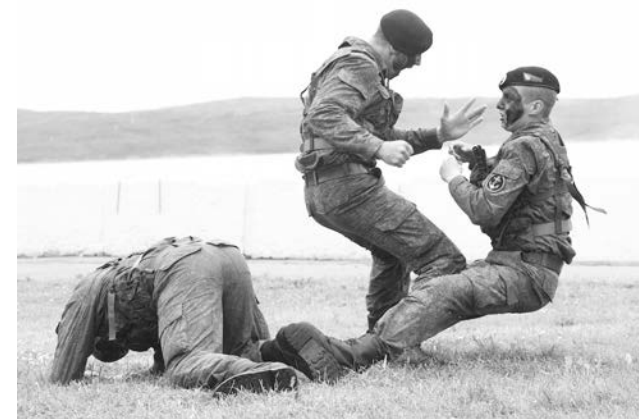
Традиционно «черные береты» продемонстрировали эффектные приемы рукопашного боя.