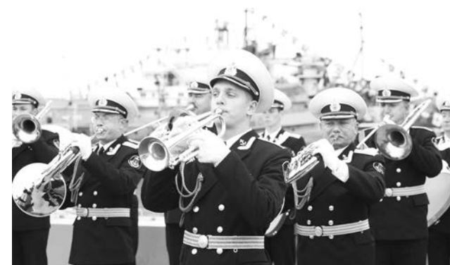
Без бравурных маршей оркестра штаба СФ не обходится ни один День ВМФ.