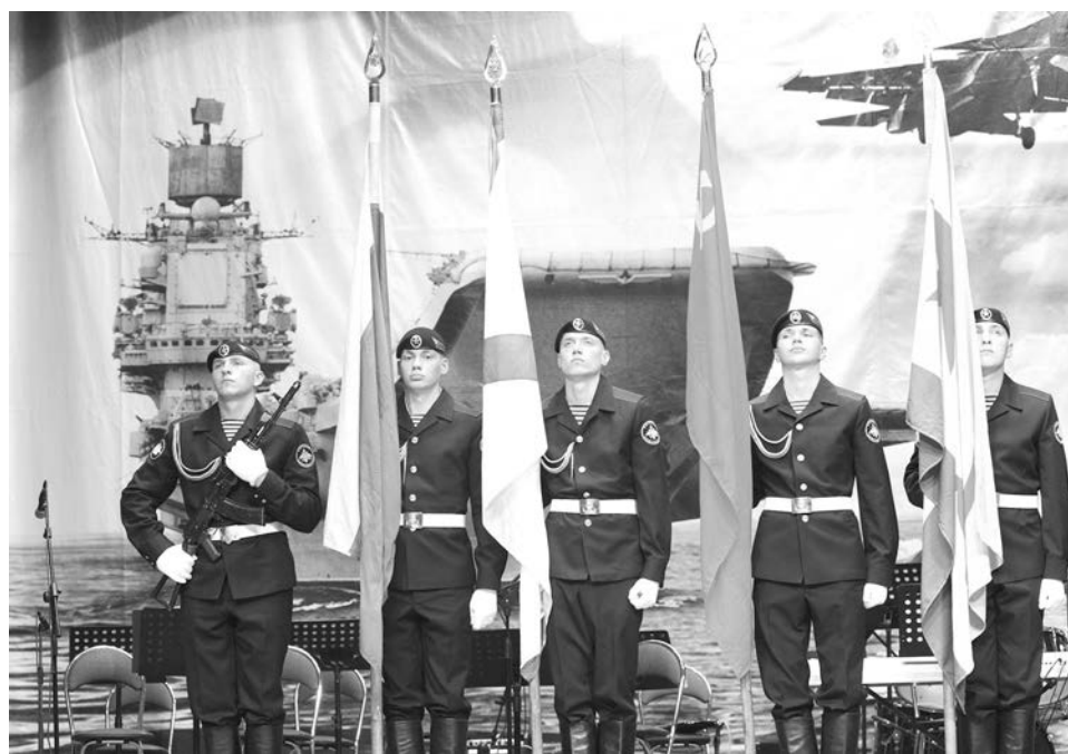
Право нести почетный караул могут заслужить лишь лучшие из лучших.