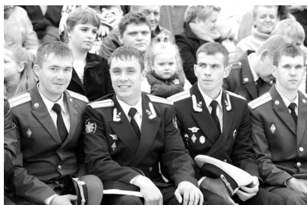
Полк морской пехоты в Спутнике пополнился выпускниками Омского танкового училища.