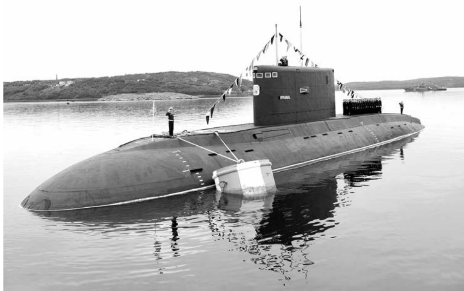
Дизельная подводная лодка «Ярославль» - смертоносное оружие для любого противника.