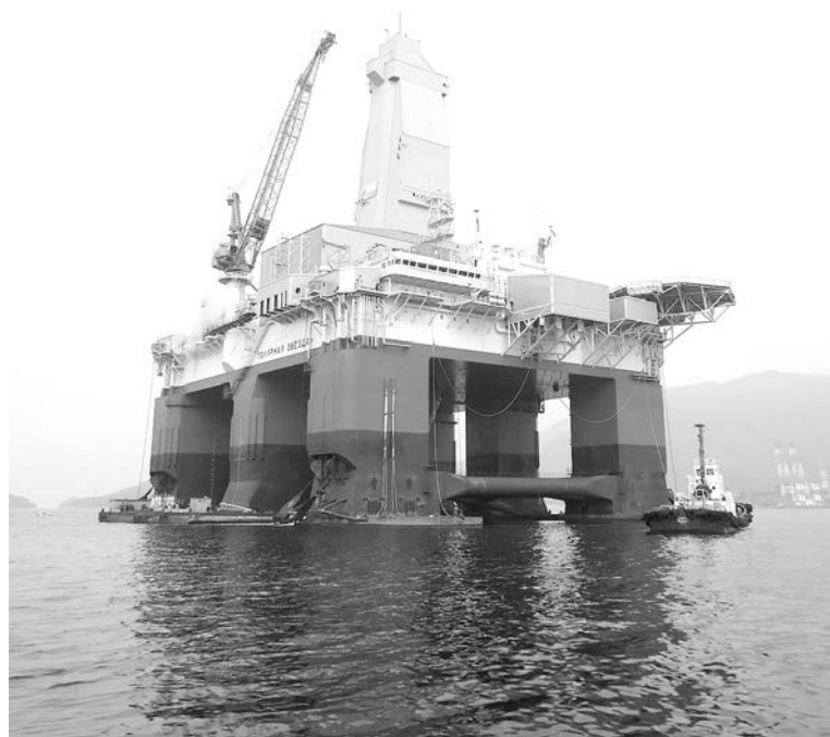
Полупогружная буровая установка «Полярная звезда», построенная для Штокмановского проекта.

Третьим поводом к оптимизму стала информация о том, что Госкомиссия экологической экспертизы 18 июля одобрила програм-