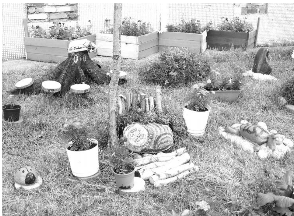
Садоводы-энтузиасты Росляково декорируют свои палисадники не только экзотической для Севера флорой, но и представителями фауны. Правда, не настоящими, а из дерева и камня.