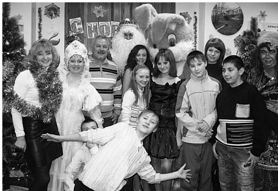
Дарить и принимать подарки одинаково приятно.