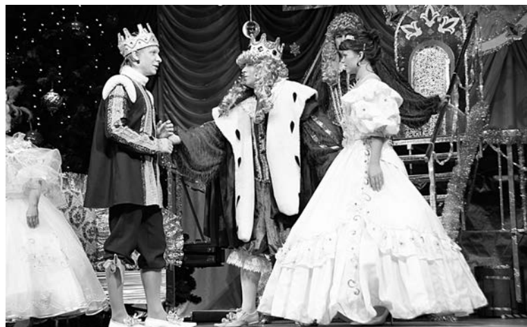
Как и положено в сказках, все закончилось счастливой свадьбой Принца и Золушки. Король доволен.

Триста самых продвинутых молодых людей и девушек веселились на 3D-дискотеке в Центре досуга молодежи «Россия». Туда по приглашению мэра пришли