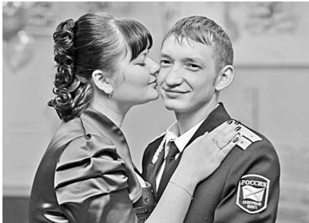
Ради такой красавицы грех не стать адмиралом.

- 2011 год будет последним, когда ваши друзья-офицеры получают существенную зарплату. А через год, с 1 января 2012 года, офицеры будут получать в три раза больше.