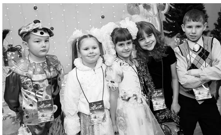
Маленькие зрители были наряжены ничуть не хуже артистов.

талантливые спортсмены, музыканты, художники и те, кто успевает учиться на «отлично» и принимает активное участие в школьной и городской жизни.