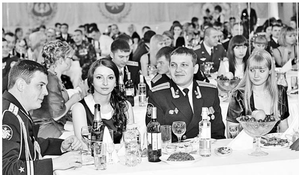
Бал - прекрасная возможность и пообщаться, и подружиться семьями.