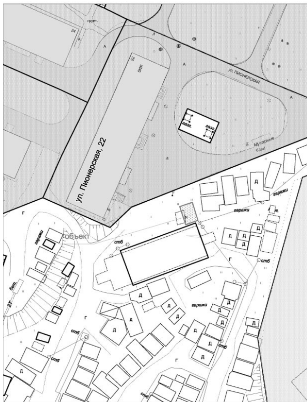
Схема размещения самовольно установленного объекта, расположенного по адресу: Мурманская обл., ЗАТО г. Североморск в районе д.22 по ул. Пионерская (кадастровый квартал 51:06:0030106)

Уважаемый владелец объекта, расположенного по адресу: Мурманская обл., ЗАТО г. Североморск в районе д.22 по ул. Пионерская (кадастровый квартал 51:06:0030106)!