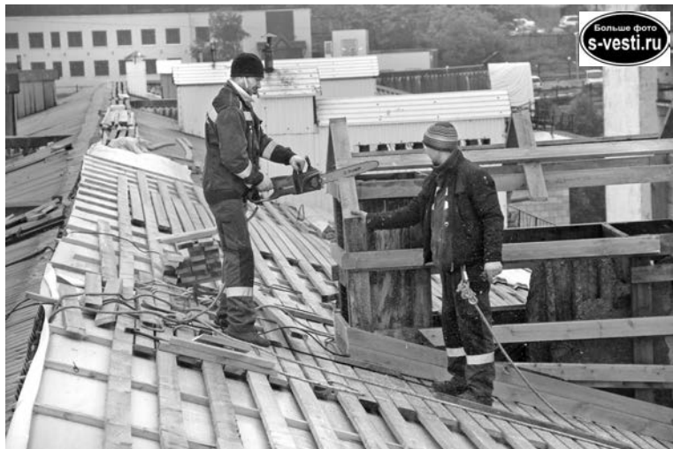
Ремонт крыши дома №11 по ул.Комсомольской. Рабочие трудятся над слуховым окном.

другие подрядчики, жалоба одна - погодные условия не позволяют уложиться в нормативные сроки. Все просят отсрочки.