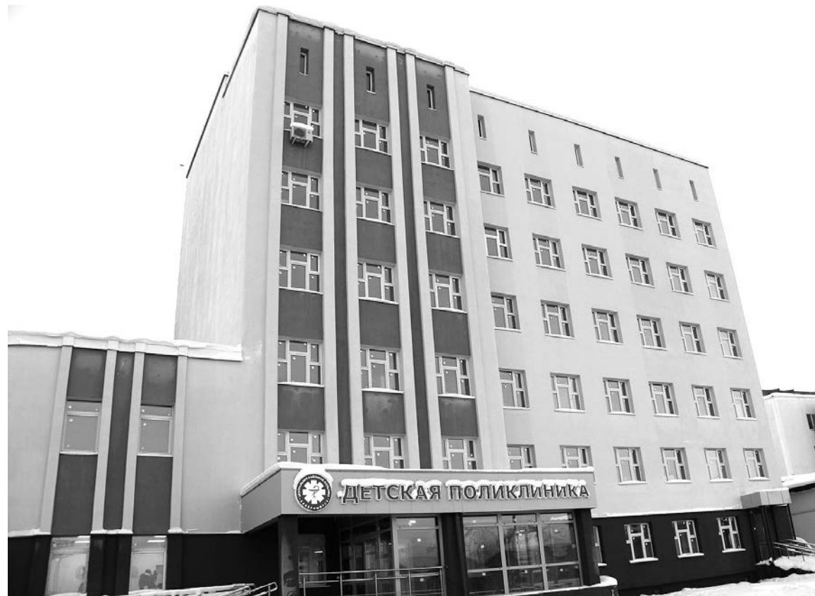
Капитальный ремонт детской поликлиники шел непросто: подводили подрядчики, преподносило сюрпризы само здание. Сегодня уже можно сказать: все хорошо!