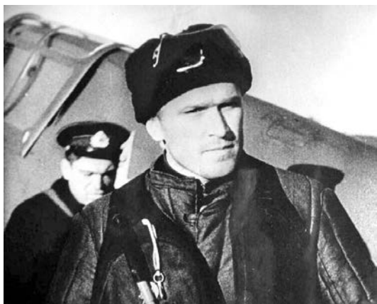
Борис Сафонов у истребителя Р-40 на аэродроме Ваенга-1.

Исследовательская работа и подготовка к передаче в музей истории города и флота фрагментов самого массового советского истребителя Великой Отечественной войны велась