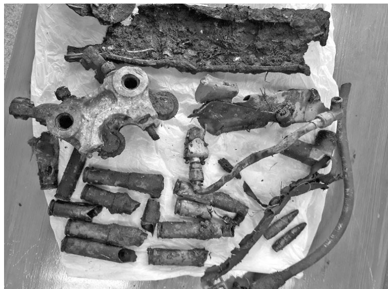
Останки самолета Р-40 Киттихаук.

почти год. Участие в них принимала небольшая группа из шести человек.