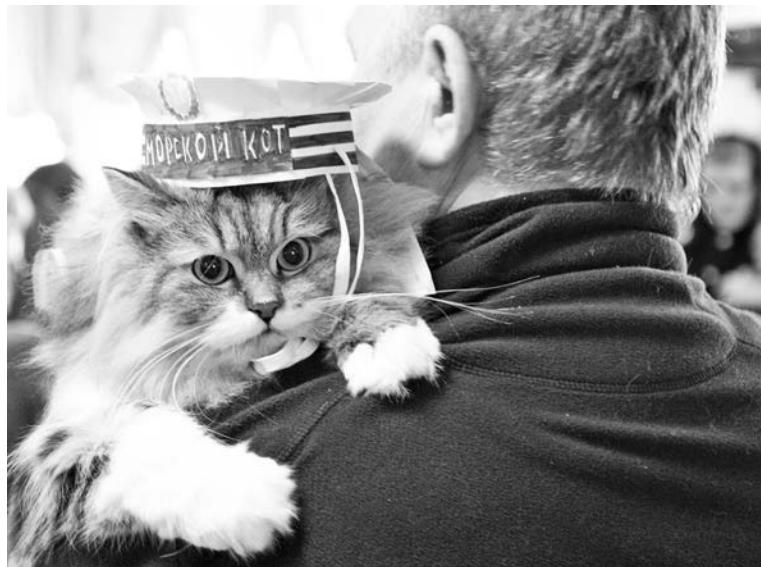
Знакомьтесь: морской кот Алекс, для домашних - озорник Сашка.