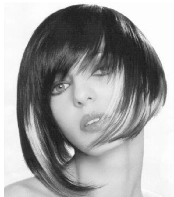
Студия красоты «Облака», ул.Корабельная, 14. Тел.: 4-20-40, 952-299-88-15.

Фитоламинирование Luaias дарит волосам особое яркое сияние и блеск, защищает волосы от УФ-излучения, морской и хлорированной воды и всех негативных факторов. Результат – роскошные здоровые волосы с шикарным блеском.