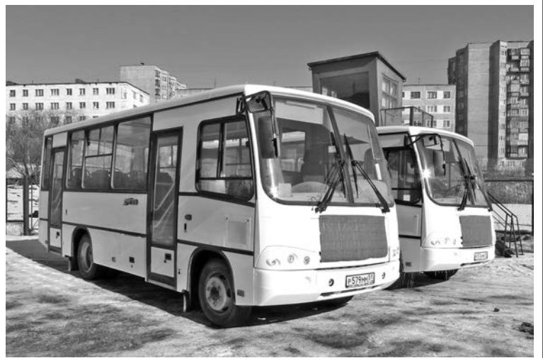
Машины Павловского автомобильного завода - удачное сочетание отечественных и зарубежных разработок.

Взаимовыгодное сотрудничество отмечают сегодняшние клиенты ООО «Арктик-Транс», работающие с предприятием по-