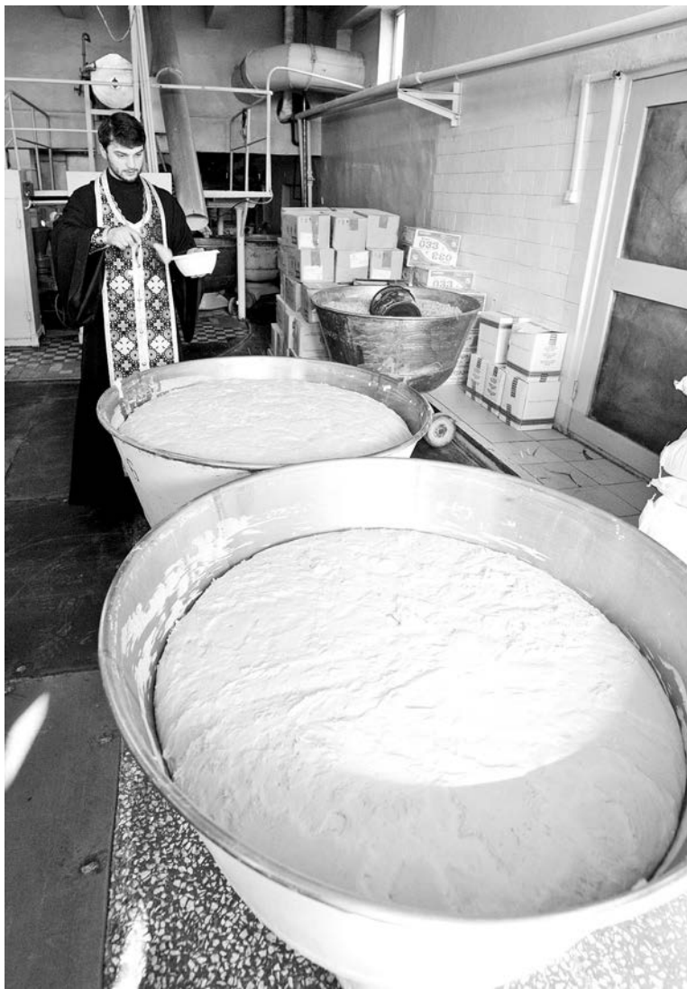
Пасхальная традиция освящения праздничных куличей для североморцев в этом году была соблюдена на мурманском хлебозаводе.