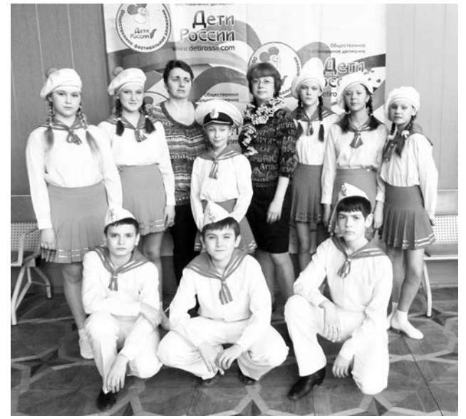
Для средней группы «Каблучка» фестиваль «Парад планет» оказался успешным дебютом.

В то же время артисты образцового ансамбля эстрадной песни «Тоника» покорила жюри, участники и зрители Междуна-