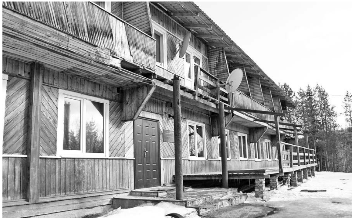
В этом доме приветливо встретят любого, будь то новый житель, его родственник, приехавший в гости, или выпускник центра.