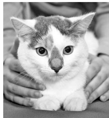
Эта очаровашка, найденная накануне конкурса в подъезде, на выставке обрела новых хозяев.