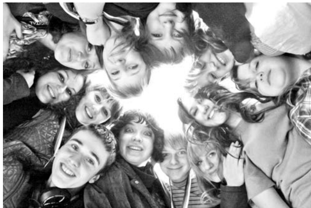
«Тоника» успела не только собрать все возможные награды «Праздник весны», но и погулять по старой Праге и Дрездену.