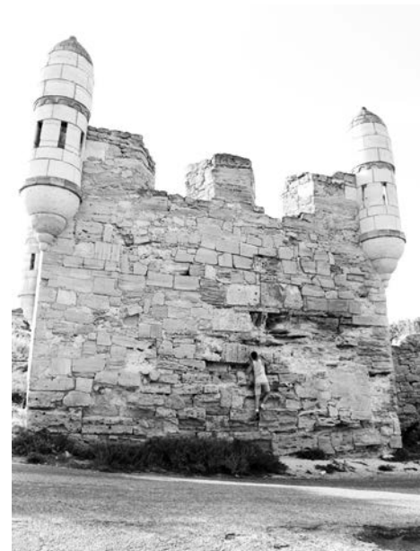
Крепость Ени-Кале была построена еще в 1703 году.

Начиная рассказ о Керчи, одни пафосно называют ее городом легенд и фактов или городом двух морей: Черного и Азовского. Другие же предпочитают цитировать строчки из песни Ляписа Трубецкого, ставшие крылатыми: «А ты был в Керчи? Не был – так молчи!» И пусть это не курорт, а турфирмы чаще предлагают выбрать местом отдыха в Крыму другие города и поселки, здесь есть на что посмотреть и чему удивиться.