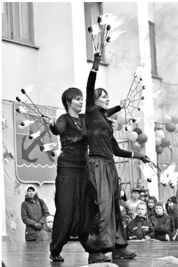
Даже проливной дождь прекратился во время огненного шоу коллектива «Сerpантин».