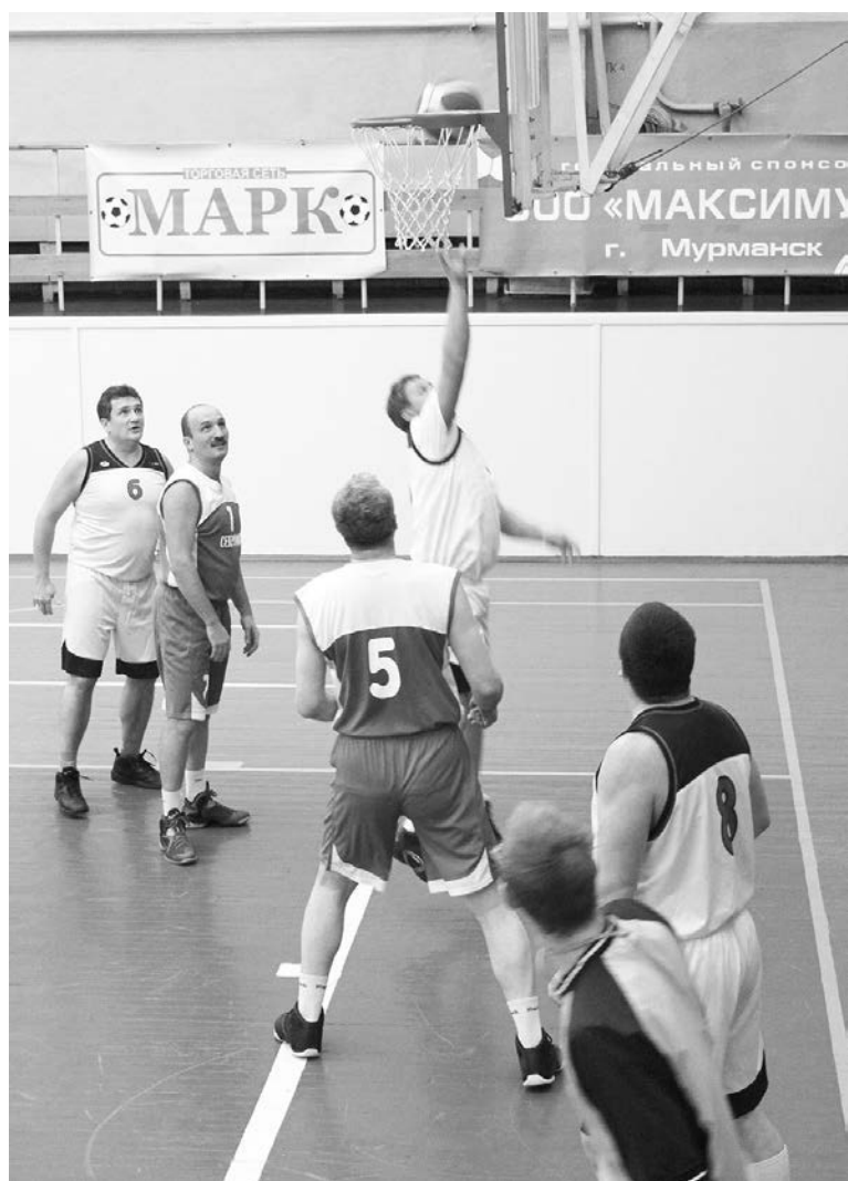
У гостей игра не ладилась: они не могли попасть в корзину даже из-под кольца.

Начинает набирать обороты чемпионат области по баскетболу. В воскресенье на традиционной домашней арене в СК «Богатырь» североморцы принимали соперников из Полярных Зорь. Поскольку у гостей нет своей женской сборной, наши баскетболистки в этот день выступали в качестве болельщиц, а встречи проходили между мужскими командами и между ветеранами.