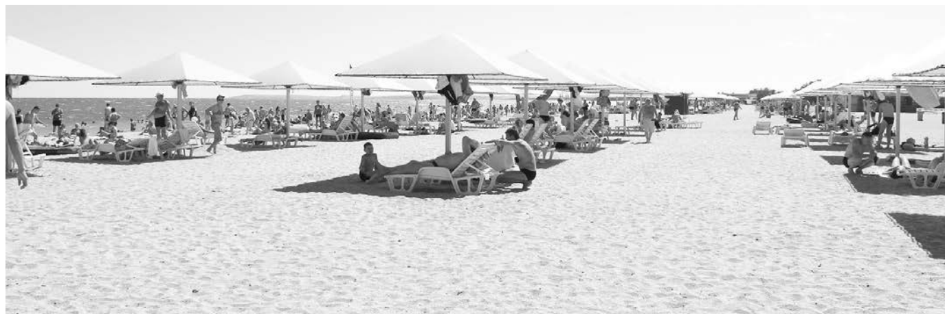
Днем на городском пляже можно наслаждаться солнцем, а по вечерам здесь проходят концерты, фестивали и дискотеки.