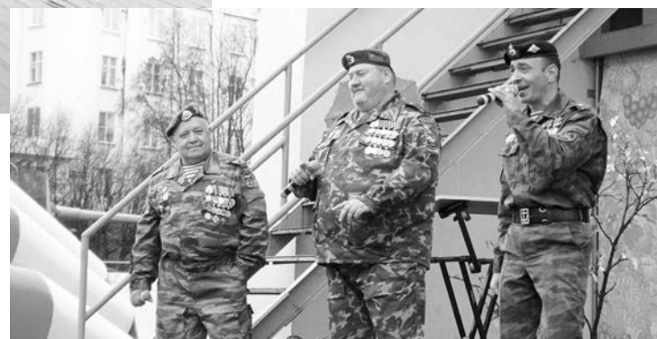
Поздравить росляковцев приехал мурманский ансамбль «Перевал».