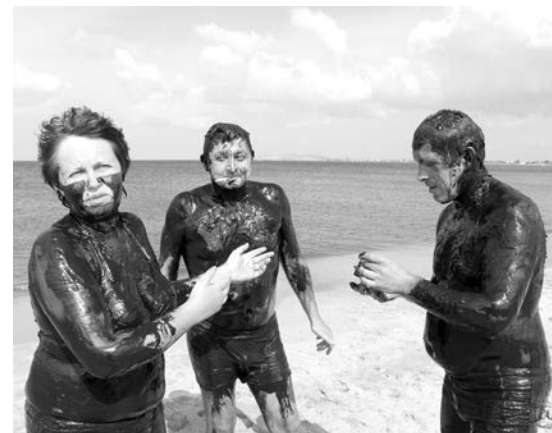
Грязью из озера можно нарисовать себе наряд, но в маршрутку в нем не пустят.