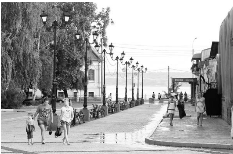
Богатая история, уникальная архитектура и доброта местных жителей - чем не повод посетить город двух морей?!