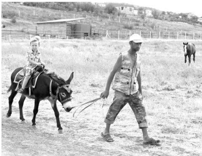
У ослика Степы не простая работа: каждый день катать детишек... Но он не жалуется.