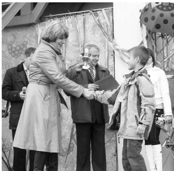
На дне рождения поселка подарки принимали и его лучшие спортсмены.