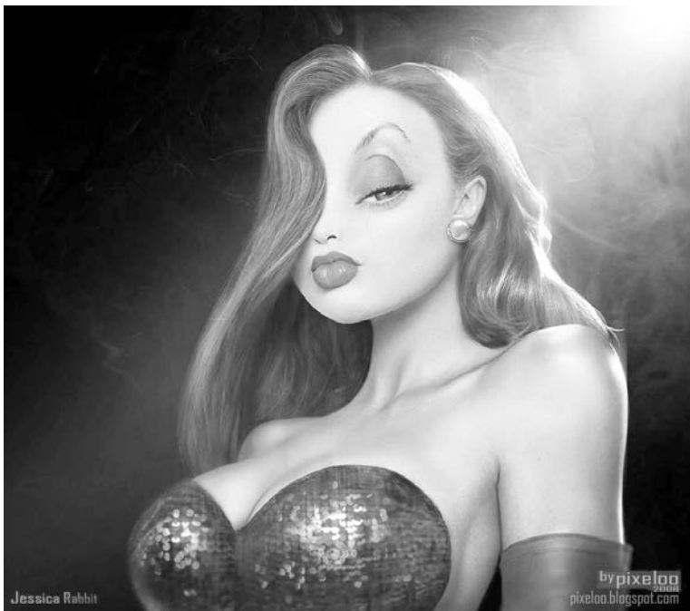
Этот мультяшный образ отнюдь не выдуманный, скорее, собирательный и гипертрофированный.

Если ресницы, то как минимум сантиметра два-три. Если волосы, то белокурые прямые длинные. Не нравится цвет глаз? Существуют линзы. Не устраивает цвет кожи? Вам поможет автозагар! Пластическая хирургия до неузнаваемости изменит лицо и фигуру. “Надувные” губы и некоторые другие части тела заполнили страницы модных журналов, почти каждый телеканал считает своим долгом показывать их крупным планом. Популярные артистки стали обидно похожи друг на друга.