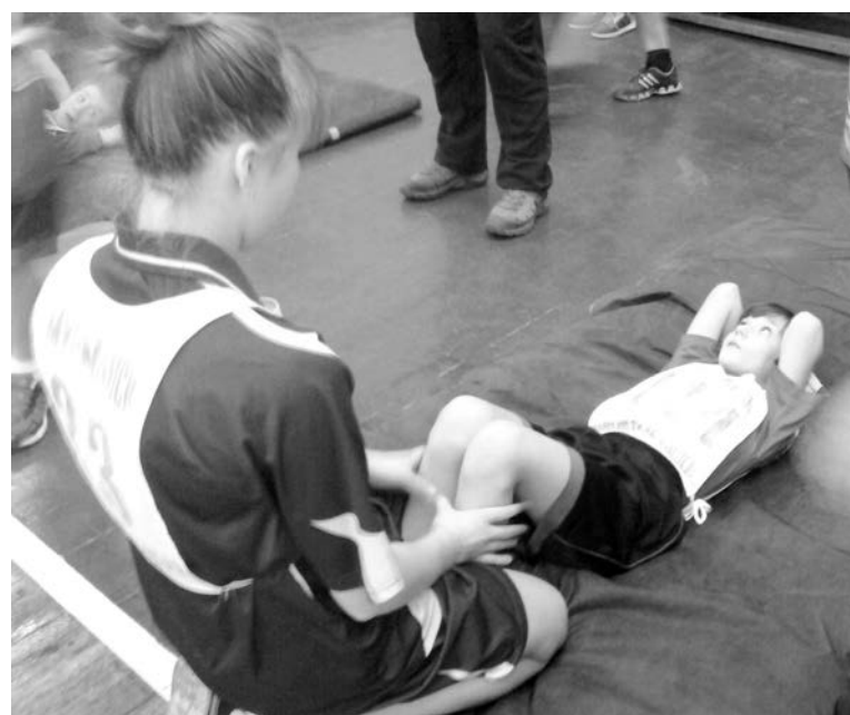
И в командном, и в личном зачете наши спортсмены были одними из лучших.