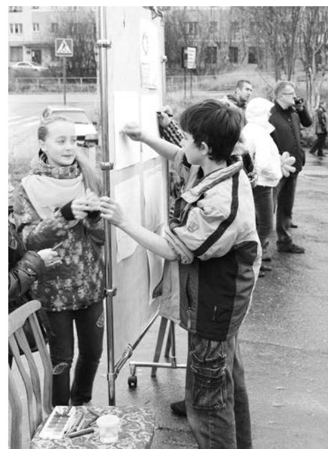
Конкурс рисунков - одна из составляющих праздничной программы.