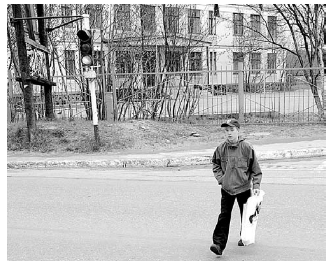
Школе №1 предложено организовать отряд юных инспекторов дорожного движения.

Еще один вопрос, стоявший на повестке дня, – о новых правилах перевозки пассажиров и багажа, вступивших в силу 1 июня. Изменения коснулись, в первую очередь, маршрутных такси, которые теперь признаны общественным транспортом, со всеми вытекающими последствиями, включая обязательность обличивать пассажиров и устанавливать на остановках распи-