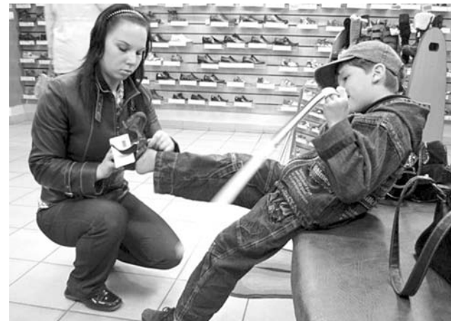
Отделение помощи семье и детям помогает североморцам и морально, и материально, например, покупкой вещей.

И.АЛЕКСАНДРОВА.