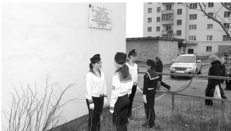
Смена почетного караула у мемориальной доски М.И. Гаджиеву.

североморцев и гостей флотской столицы музей истории города и флота и Детский морской центр им.Пикуля (бывший клуб юных моряков) проводят Вахты памяти. 27 января, в день рождения Ивана Сивко, юные моряки стояли в почетном карауле у мемориальной доски Герою Советского Союза. 4 марта 55 лет исполнилось бы Герою России Тимуру Апакидзе. У юста Тимуру Автандиловичу также стояли в карауле кюмовцы.