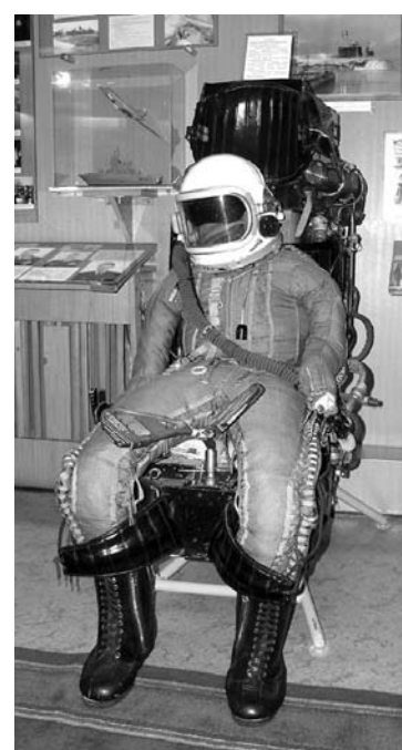
Комплекс средств спасения и жизнеобеспечения: катапультное кресло (установка К-86) и защитное снаряжение летчика.