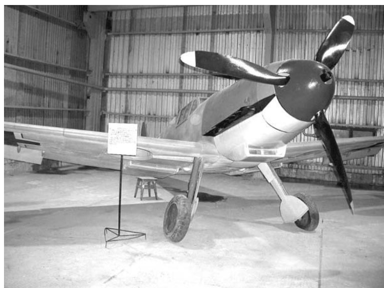
Истребитель «Мессершмит-109 G-6».