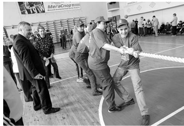
Североморский «Медведь» пытается одолеть команду Полярного.

С 9 по 12 июня в СК «Богатырь» будет проходить первенство Североморска по шахматам. Приглашаются все поклонники этой игры. Начало соревнований 9 июня в 18.00.