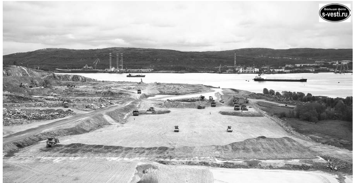
Мостовой переход через реку Тулому - важная часть строительства новой железнодорожной линии от станции Выходной до будущего порта на западном берегу Кольского залива.