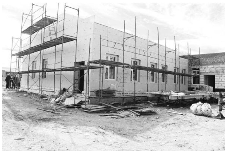
Ясли-сад на 75 мест в Авиагородке должен быть сдан в конце 2019 года.

- Это сопоставимо с шагами по квартире , - пояснил гене-