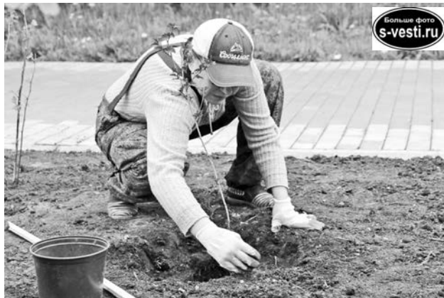
Озеленение городского парка началось с высадки растений на одной из клумб.