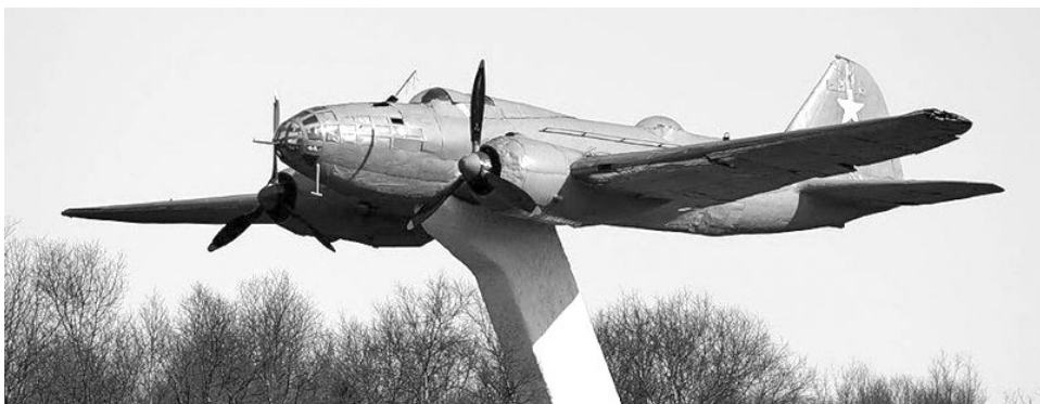
Памятник авиаторам-североморцам «Самолет Ил-4» открыт 26 июля 1981 года на площади Мужества.