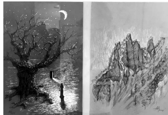
Пейзажные зарисовки Александра Мирного (бумага, шариковая ручка).