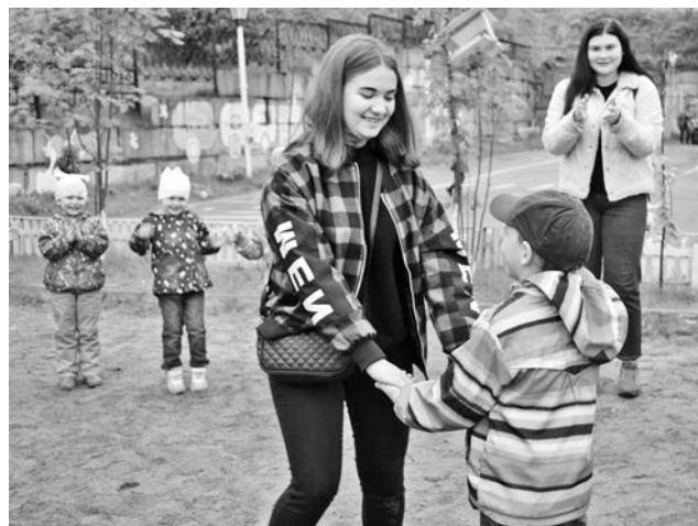
Девушки-волонтеры успели и хоровод поводить в честь именинника.

Наталья СТОЛЯРОВА, Любовь ЧЕБАНУ. Фото авторов.