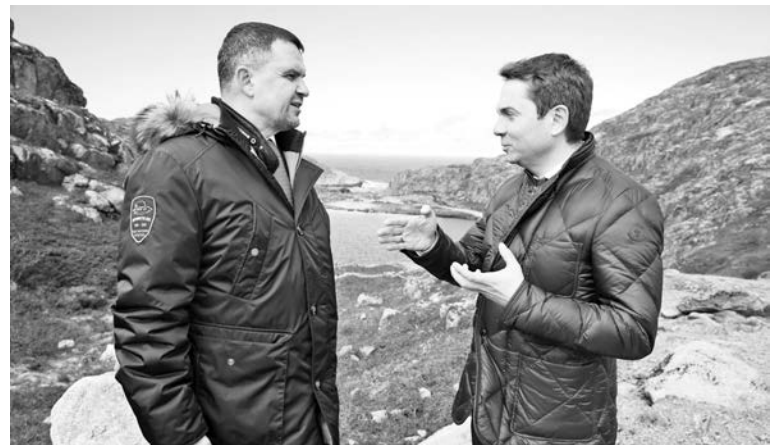
Максим Акимов и Андрей Чибис в Териберке. За величественными северными пейзажами туристы едут сюда даже по бездорожью. Новая дорога даст поселку поистине новую жизнь.

Дороги – одна из общероссийских бед и острая проблема Мурманской области, где в ненормативном состоянии находится половина трасс. Вместе с главой региона Максим Акимов проверил и ремонт полотна по нацпроекту «Безопасные и ка-