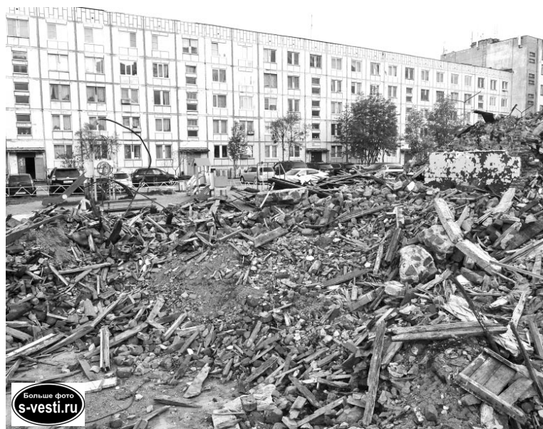
Остается надеяться, что дети будут выбирать для игр детскую площадку, а не кучу мусора.