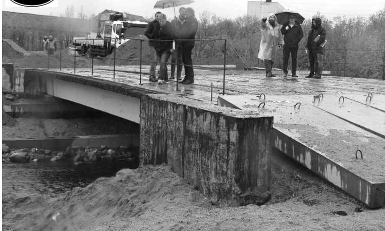
Ширина проезжих частей нового моста составит по 3,5 м каждая. Еще 1,5 м уйдет на пешеходные зоны.