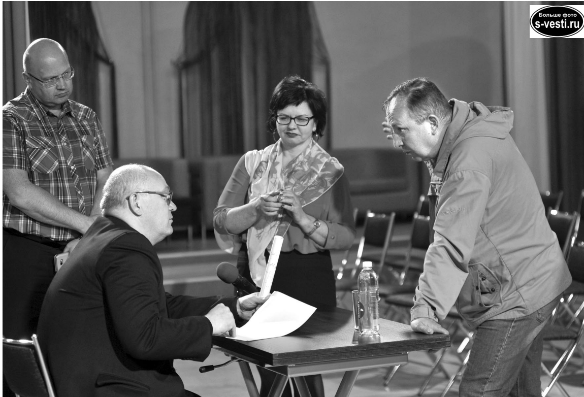
После завершения встречи с главой ЗАТО североморцы не спешили расходиться, еще раз акцентируя внимание на городских проблемах.

- Ваше письменное обращение получено. Действительно на кровле установлена на возмездной основе антенна МТС, 18 тыс. руб. капает на счет МКД ежемесячно. Вы справедливо решили, что раз эти деньги на счет дома пришли, то вы вправе решать, на что их потратить. Ваше обращение направлено в КРГХ, специалисты которого запросят у УК ее позицию по этому вопросу. Администрация ЗАТО придаст этой переписке ускорение. Если подтвердится, что деньги управляю-