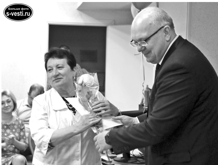
Медицинские работники Североморска были награждены благодарностями Минздрава РФ, Мурманской области, главы ЗАТО и почетными грамотами ЦРБ.