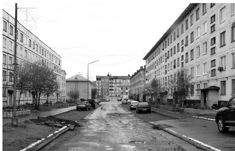
Работы по благоустройству дворов на ул.Героев-североморцев, 10, 12, выполняются в рамках программы "Формирование комфортной городской среды".