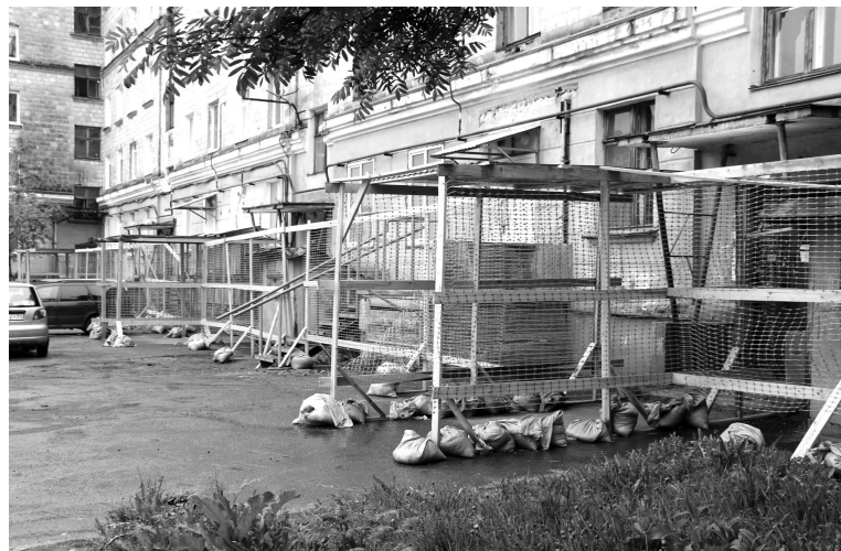
Капитальный ремонт кровли на ул.Комсомольской, 11, начался с выставления ограждения.

Еще одна организация, которая выполняет ремонтные работы в Североморске-3, — ООО «Евросангрупп». Подрядчик заканчивает планировку дворов на ул. Героев-североморцев, 10 и 12, с последующим обустройством карманов для парковки авто за