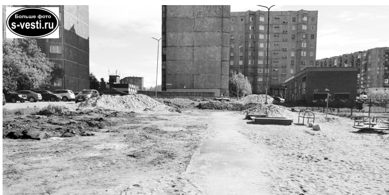
На ул.Полярной, 4, подрядчик приступил к работам, демонтировав часть старых элементов детской площадки.

В ЗАТО Североморск с 2017 года реализуется федеральный приоритетный проект «Формирование комфортной городской среды», в рамках которого ремонтируются дворы, реконструируются или создаются заново детские игровые и спортивные площадки, проводится замена асфальтового покрытия, освещения, благоустройство общественных территорий.