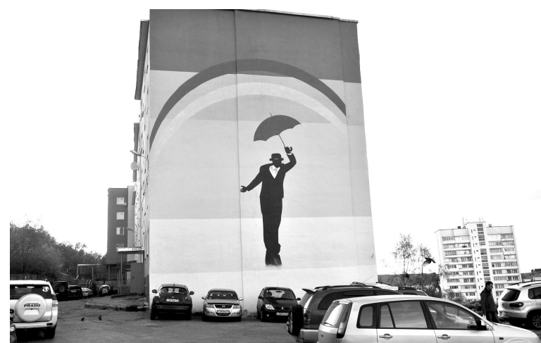
Один из муралов был нанесен на торец дома №28 на ул.Душенова в 2017 году.