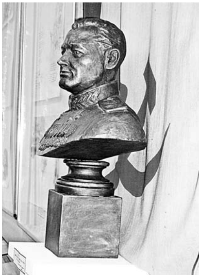
П.И.Абарин, бюст адмирала Советского Союза Н.Г.Кузнецова.