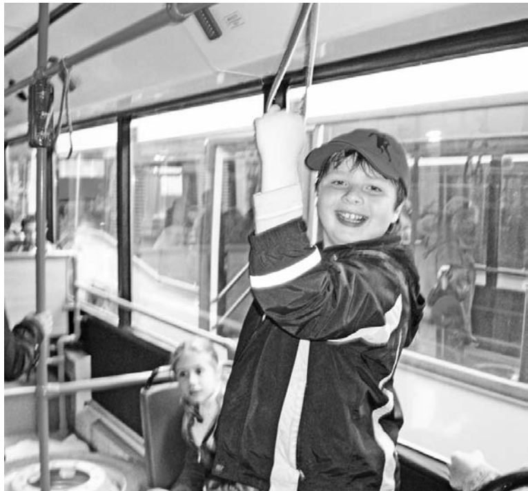
Ребята уже оценили новые автобусы. Теперь очередь за папами и мамами.

В автопарке Североморского АТП пополнение - восемь МАЗов, только сошедших с конвейера. Автобусы рассчитаны на 96 мест, из них сидячих - 21. Детища Минского автозавода интересны и тем, что «начинка» у них немецкая, фирмы «Мерседес».