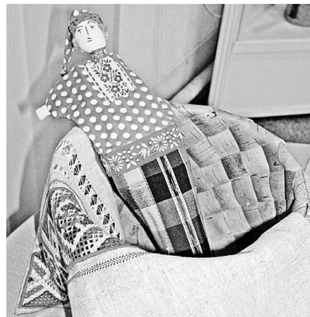
Такой Петрушка развлекал детвору 100 лет назад.