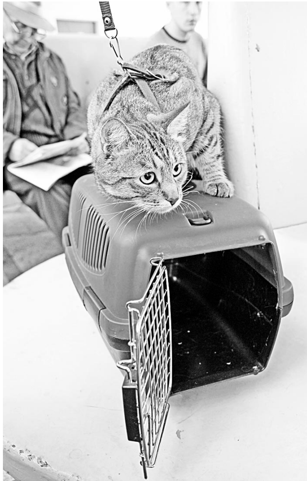
Непривычная обстановка вводит кошек в состояние сильного стресса.

Поводок или шлейка. Передвижение пса на поводке - мероприятие привычное и для животного, и для хозяина. А вот заставить ходить на поводке кошку не так-то просто. Так как кошки с легкостью стаскивают с себя ошейник, придется приобрести шлейку - ремень из ткани или из кожи, который обхватывает не только шею, но и брюшко животного под передними лапами. О прогулках речь не идет, если только киска не привыкла к ним с детства. Шлейка - это, скорее, средство контролировать передвижение животного, если оно настойчиво просится из клетки. В поезде можно позво-