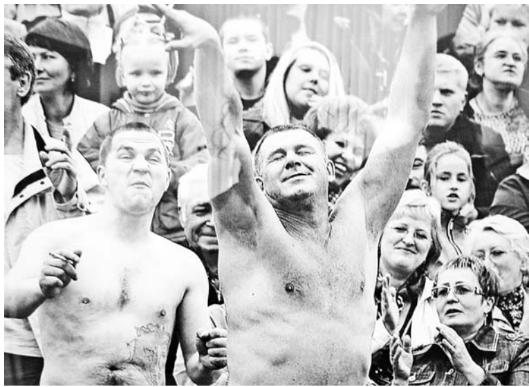
Так отмечали в Мурманске праздник в прошлом году.