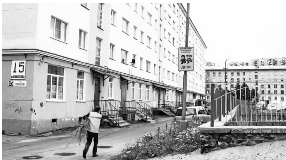
С присоединением д/с №22 количество групп в д/с №31 увеличится до семи.

кой школе смогут не только ребята из неполных семей и оставшиеся без попечения родителей, а все желающие. Но это планы. А пока в Североморске две общеобразовательные школы-интерната.