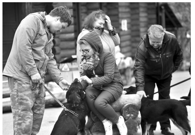
Подопечные приюта "Надежда" были рады общению и праздничной атмосфере.

- Наша задача сегодня была собраться, независимо от погоды, преодолеть 100 км до Североморска и принять участие в ме-