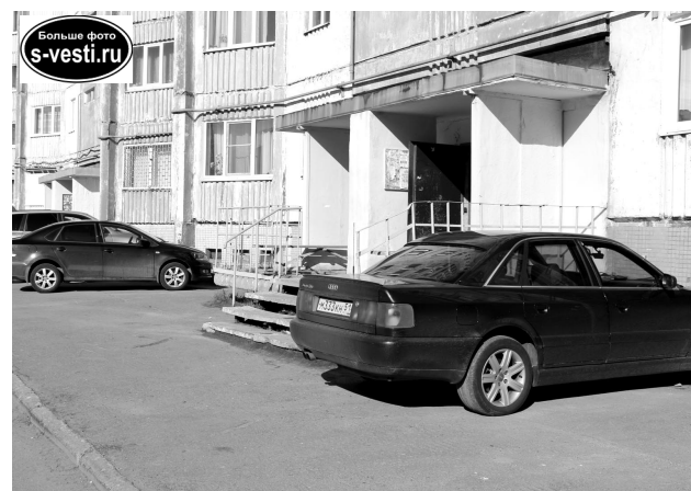
Особое внимание при производстве БВР будет уделено дому №5 на ул. Сев. Застава.

- Мы передали в Ростехнадзор уточненные расчеты сейсмического воздействия от буровзрывных работ на дом №5. Он находится в самой дальней точке от БВР - в 170 м, ближайшая - 80 м, опасная зона - 50 м, - сказал директор подрядной организации ООО «Специальные