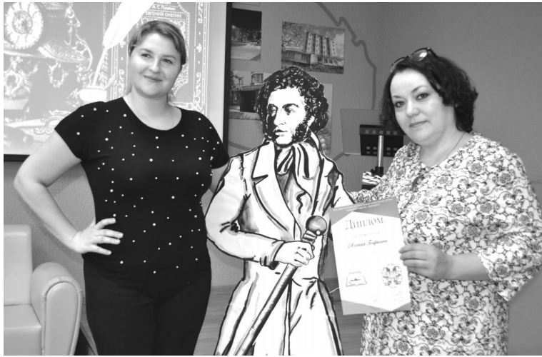
Все желающие могли сфотографироваться с виновником торжества - Александром Пушкиным.