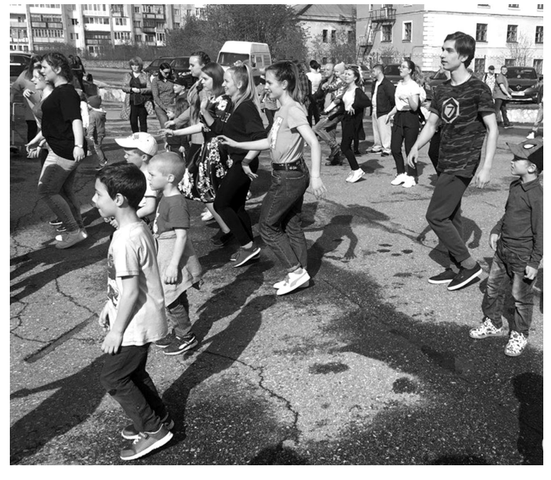
Планируется, что следующий танцевальный марафон пройдет на Приморской площади.