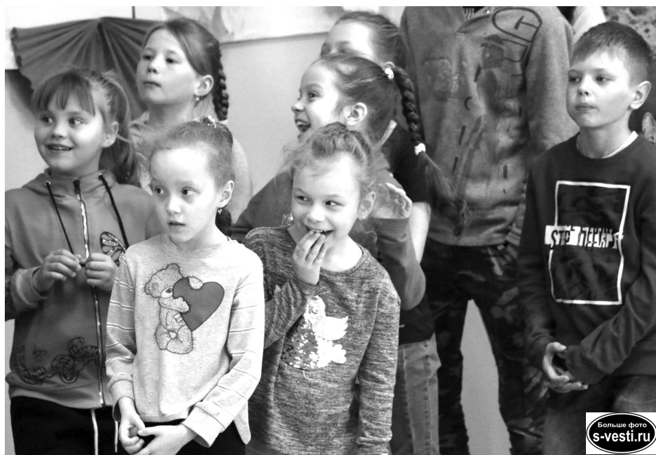
Больше фото s-vesti.ru