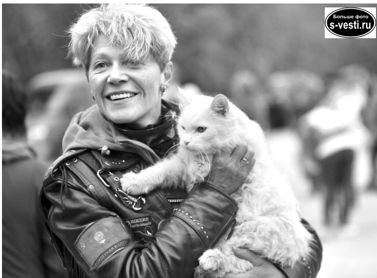
Почти каждого байкера дома ждет любимый питомец.