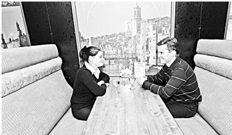
Все в интерьере настраивает на душевное общение: мебель из дерева и текстиля, теплые цвета, спокойное освещение.