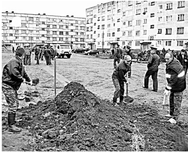
На призыв депутатов откликнулись более 60 местных жителей.

Не обойдены вниманием и автовладельцы, для которых расширены две автостоянки. Сегодня здесь единственное место в нашем ЗАТО, где для жителей близлежащих домов практически нет проблемы с парковкой автомобилей.