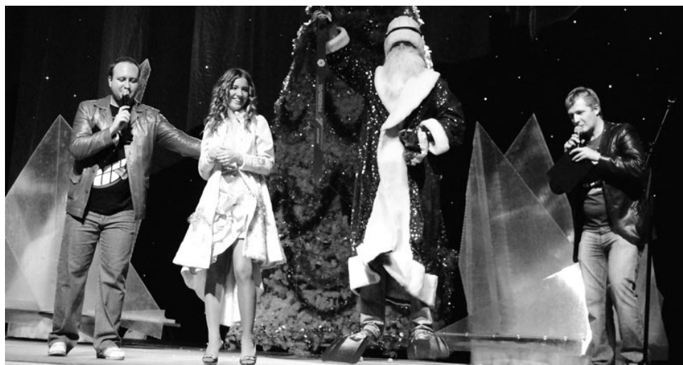
Ведущие вместе с залом выбрали Снегурочку.