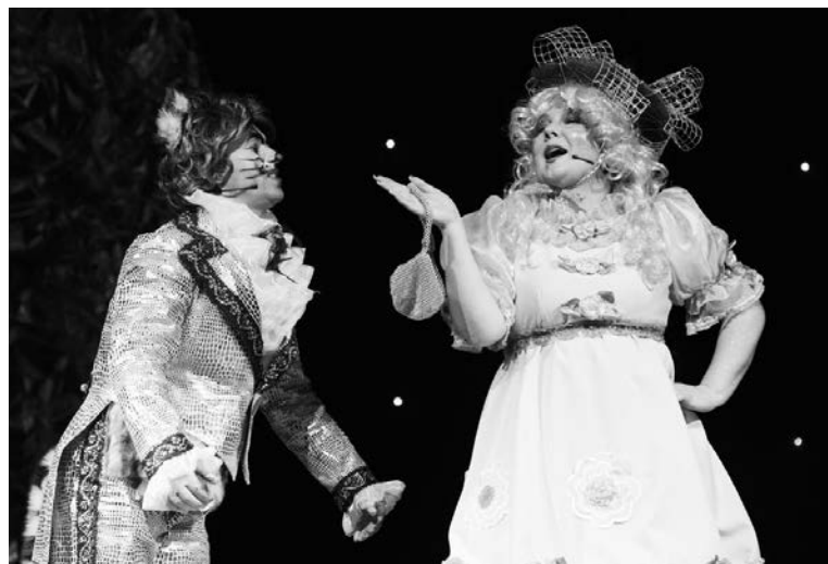
Ни дикому Коту Матвею, ни вредной Кикиморе не удалось украсть у ребят праздник.

А на следующий день для 250 одаренных ребят 8-13 лет в ДК «Строитель» состоялась новогодняя ёлка главы ЗАТО. Дети попали в атмосферу волшебства, посмотрев спектакль по мотивам сказки «Маша и Витя против «Диких гитар», и даже старались помочь ее героям справиться с трудностями и спасти Снегуроч-