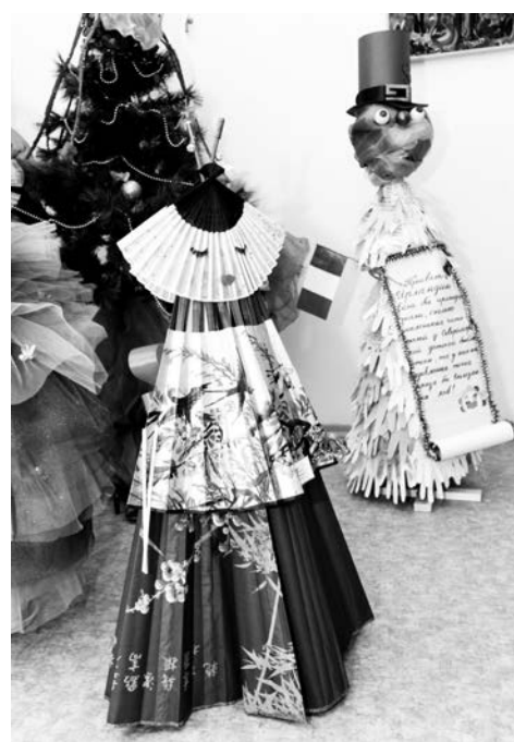
Ёлки-гейши и ёлки-ирландцы вряд ли бы встретились в жизни!