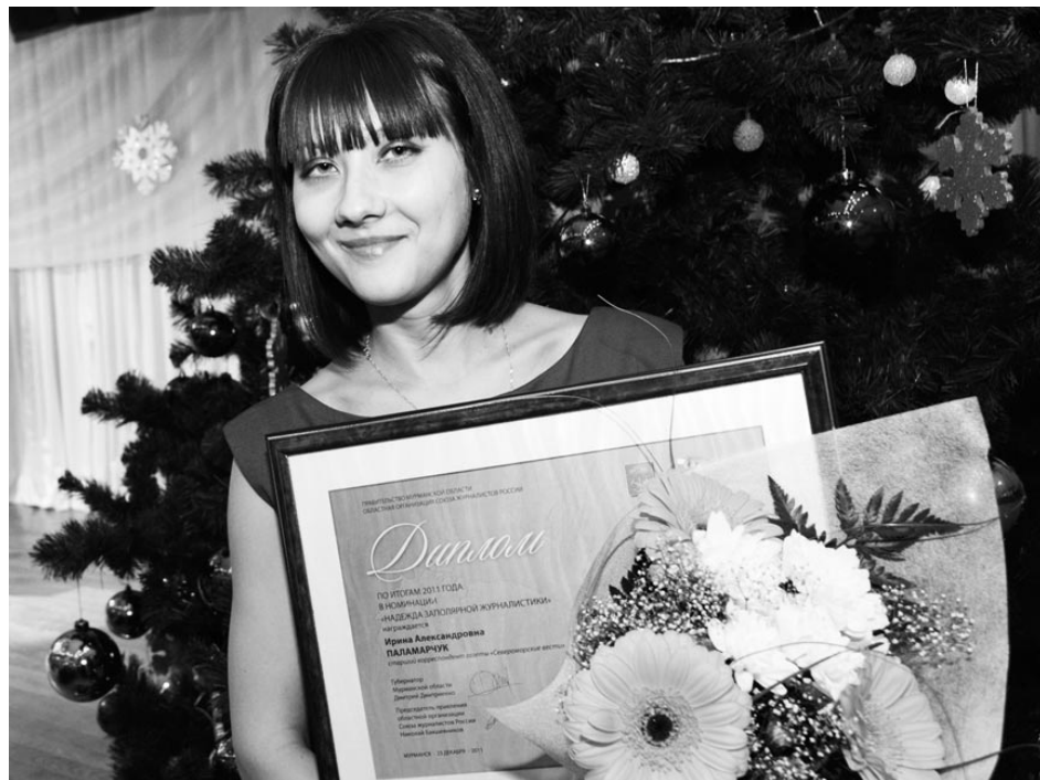
Материалы старшего корреспондента «СВ» Ирины Паламарчук остро социальные и злободневны.