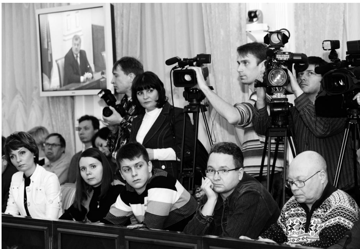
На пресс-конференции собрались более 60 журналистов СМИ всей области.

– Те детские сады, которые могут функционировать в гражданской системе, будут работать, а те, которые не могут быть реконструированы так, чтобы они соответствовали всем санитарным требованиям, будут закрыты, но дети без