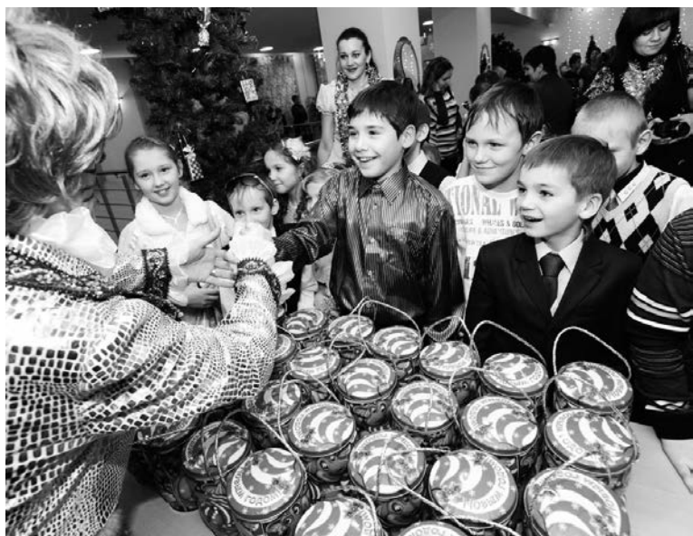
Прекрасный спектакль, а после него долгожданные сладкие подарки - залог новогоднего настроения.

До наступления Нового года остался всего один день, а вся минувшая неделя прошла в ритме настоящего ёлочного марафона. Один за другим новогодние спектакли, концерты, дискотеки проходили на разных площадках города и области, даря детям праздничное настроение.