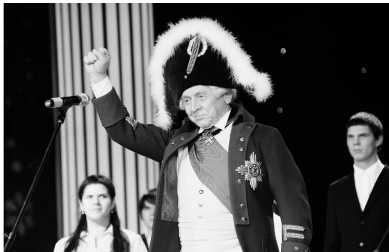
На этом балу было место чуду: нынешних защитников пришли поздравить герои былых времен.