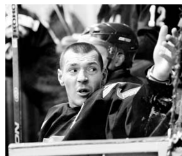
На скамейке запасных тоже кипели страсти.

ество североморцам не удалось даже играя 5 на 3. Только в первом периоде в сетке наших ворот побывали 4 безответные шайбы. После этого команды ушли на перерыв.