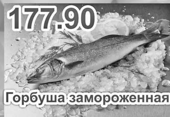
177.90 Горбуша замороженная