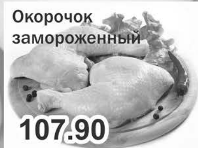
Окорочок замороженный 107.90