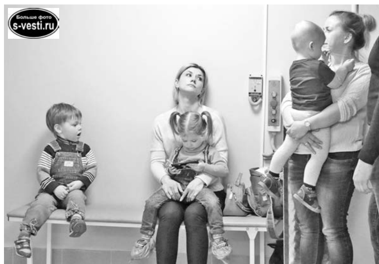
Очереди к хирургу североморцы давно воспринимают философски. А когда было по-другому?