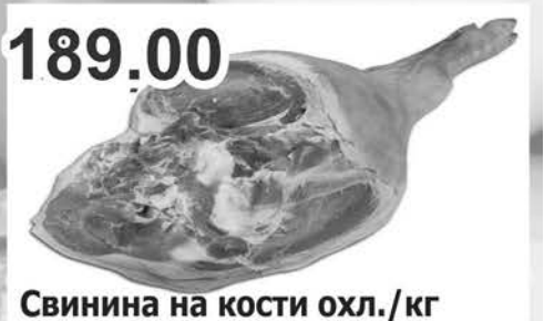
189.00 Свинина на кости охл./кг