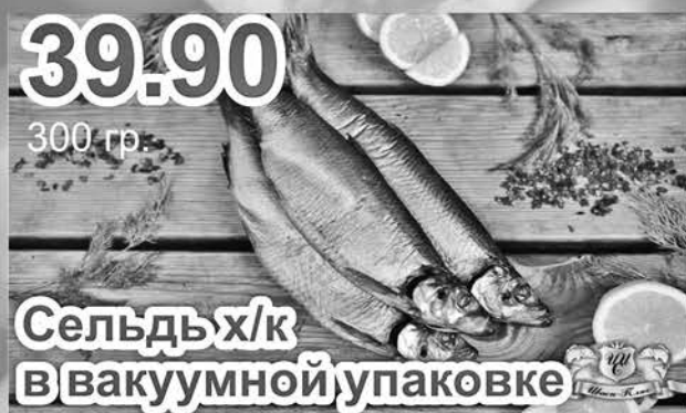
39.90 300 гр Сельдь х/к В вакуумной упаковке