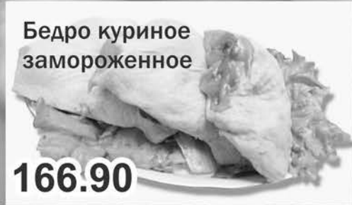
Бедро куриное замороженное 166.90