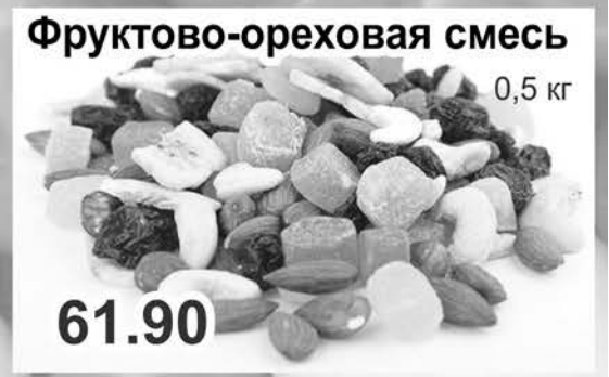
Фруктово-ореховая смесь 0,5 кг 61.90