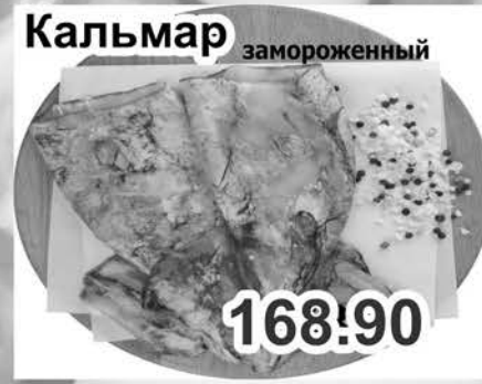
Кальмар замороженный 168.90