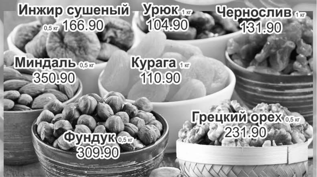
Инжир сушеный 0,5 кг 166.90