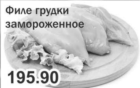
Филе грудки замороженное 195.90