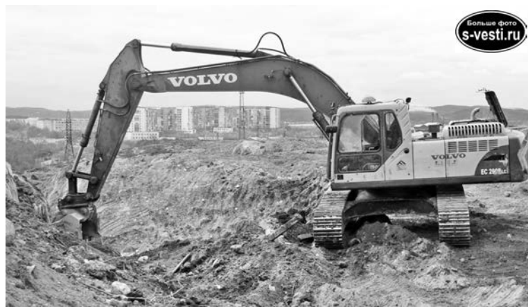
Когда-то здесь был гаражный массив, а скоро появится новая школа с открытым спортивным кортом.

Если в прошлом году в первые классы пошло более 900 ребят, то в этом цифра увеличилась. Это влечет за собой ряд негативных моментов: увеличивается