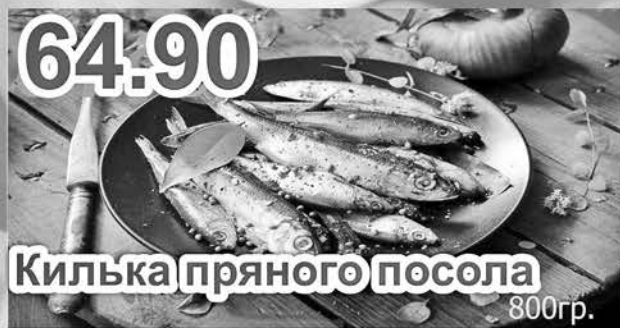
64.90 Килька пряного посола 800 гр.