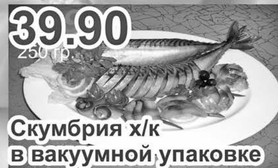
39.90 250 гр Скумбрия х/к В вакуумной упаковке