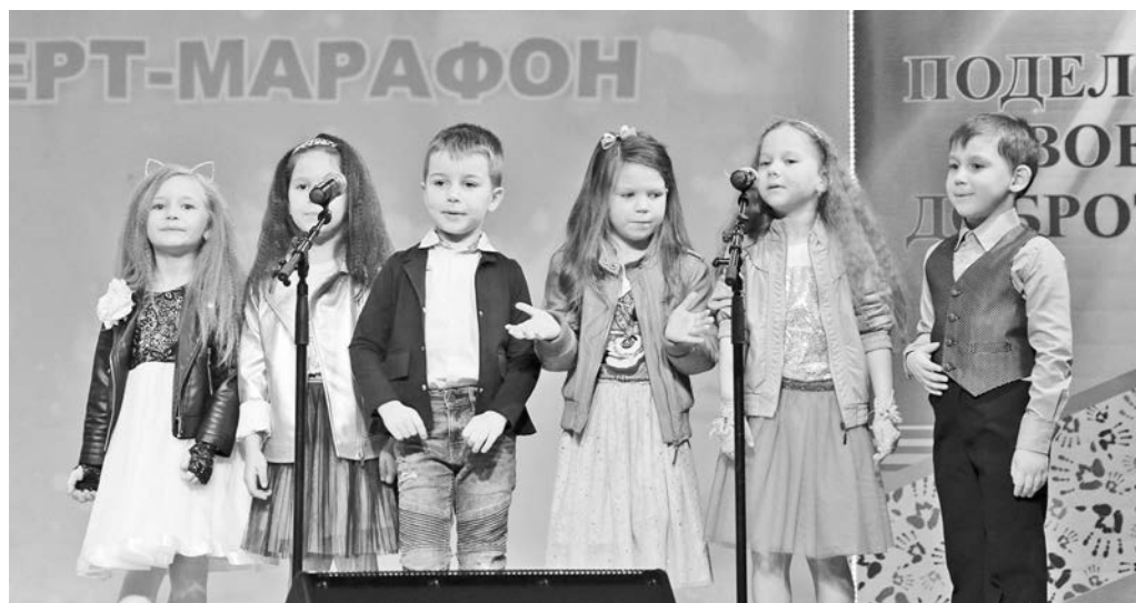
Благодаря подобным акциям, милосердие закладывается с раннего детства. Дошколята и школьники - самые активные участники концерта-марафона.