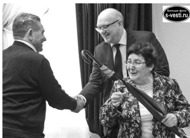
Встреча с почетными гражданами накануне Дня города - хорошая традиция.

На память о встрече почетные граждане Североморска получили презент