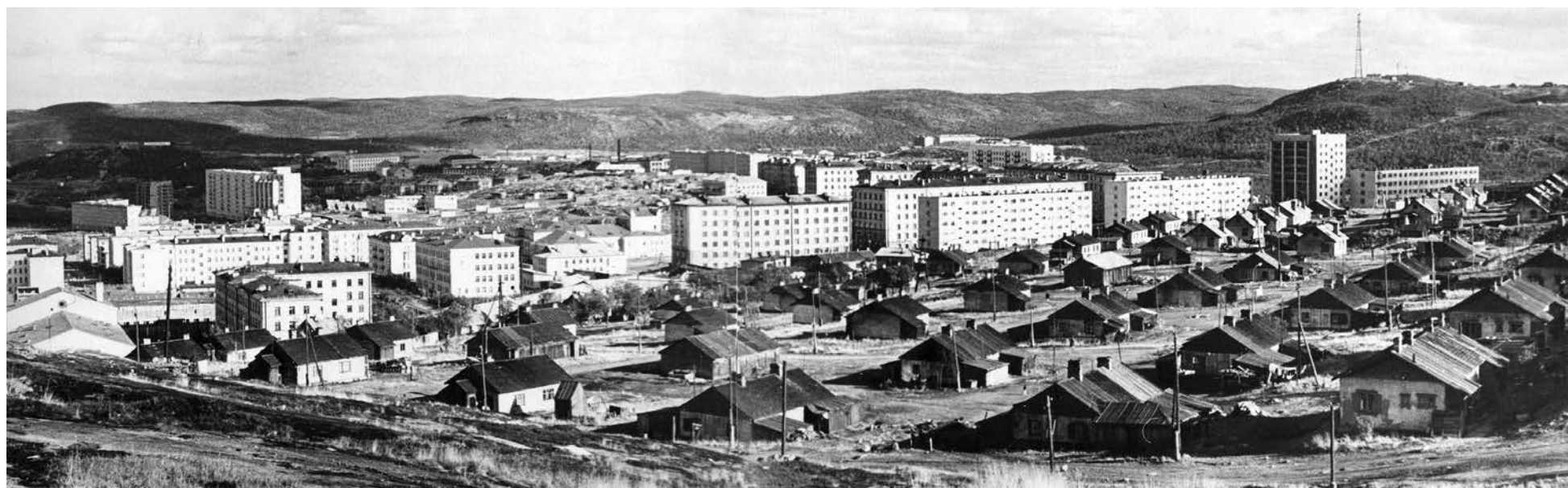
Улица Надгорная с линиями финских домиков. Впереди грандиозная застройка: многоэтажка №8/11 по ул.Душенова, здания общежития АКИНа и нынешней детской поликлиники, СШ №7, д/с №11 и 16.