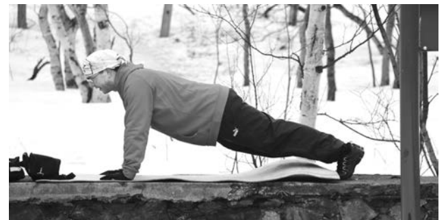
Сдача нормативов для многих стала одним из легких заданий, а вот дорога к площадке ГТО не очень простой.

Любовь ЧЕБАНУ.