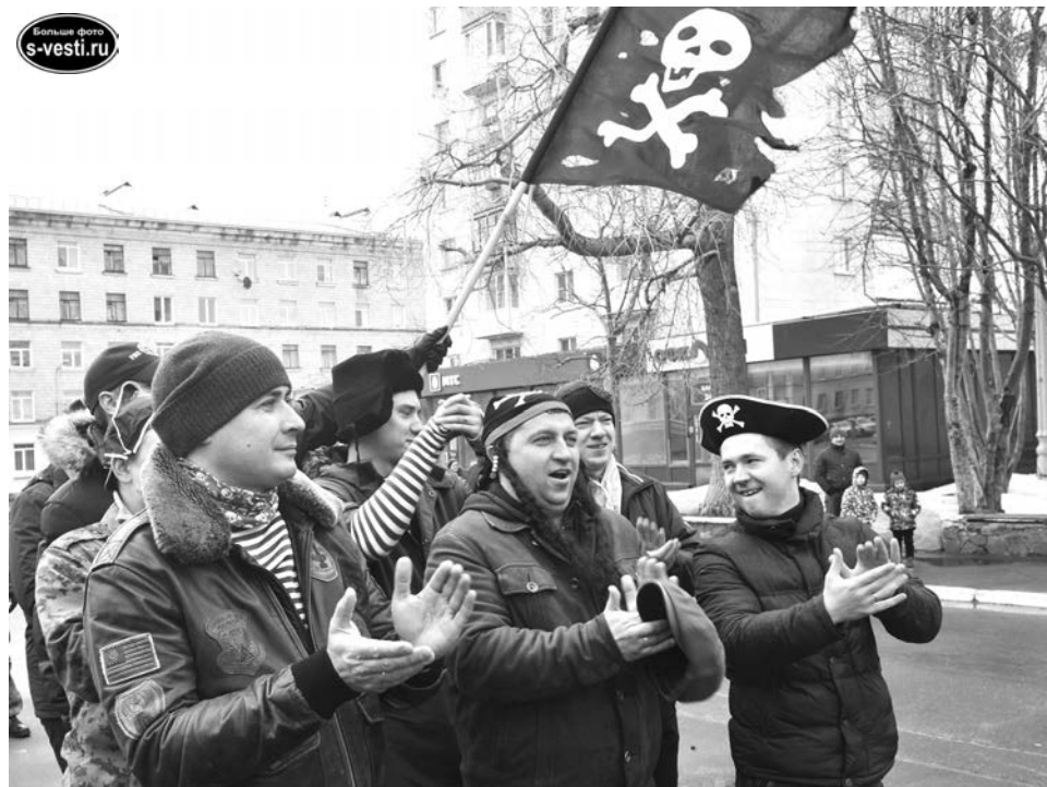
Команда СПСЧ №2 «Пираты» ФГКУ СУ ФПС №48 МЧС РФ - постоянные участники и уже задумались над костюмами для игры в следующем году.