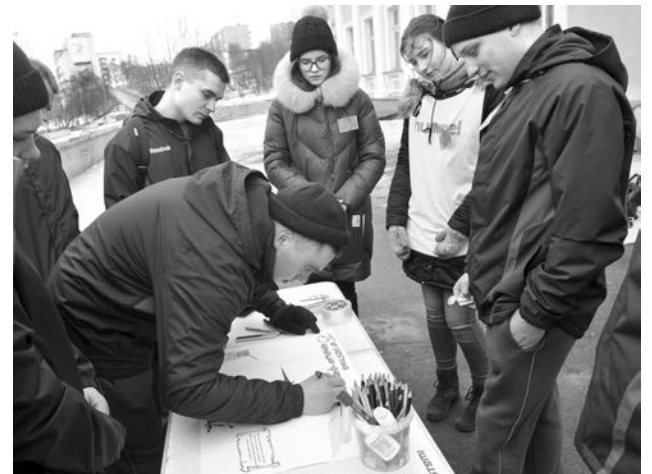
У ДОФа команды рисовали газету или боевой листок, посвященные 75-й годовщине разгрома немецко-фашистских войск в Заполярье.