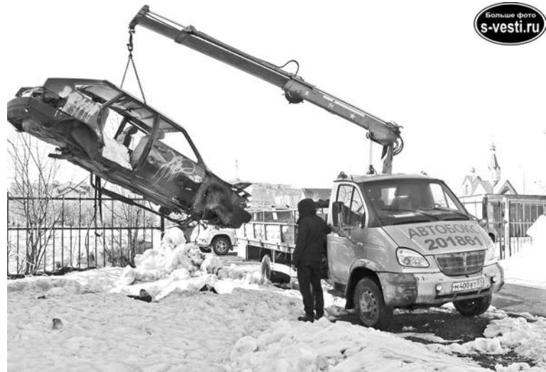
Вывоз разукомплектованного авто на ул.Советской.

16 апреля под председательством министра энергетики и ЖКХ Мурманской области Владимира Гноевского в Североморске прошло выездное совещание штаба по наведению порядка после зимы.