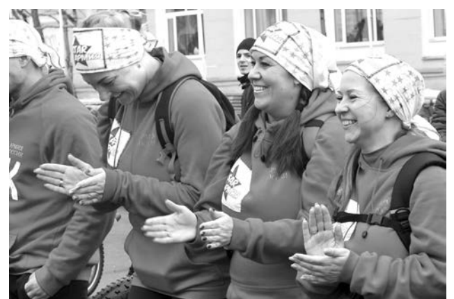
Команде "Star Армия" соединения 1 дивизии ПВО до победы не хватило совсем чуть-чуть.