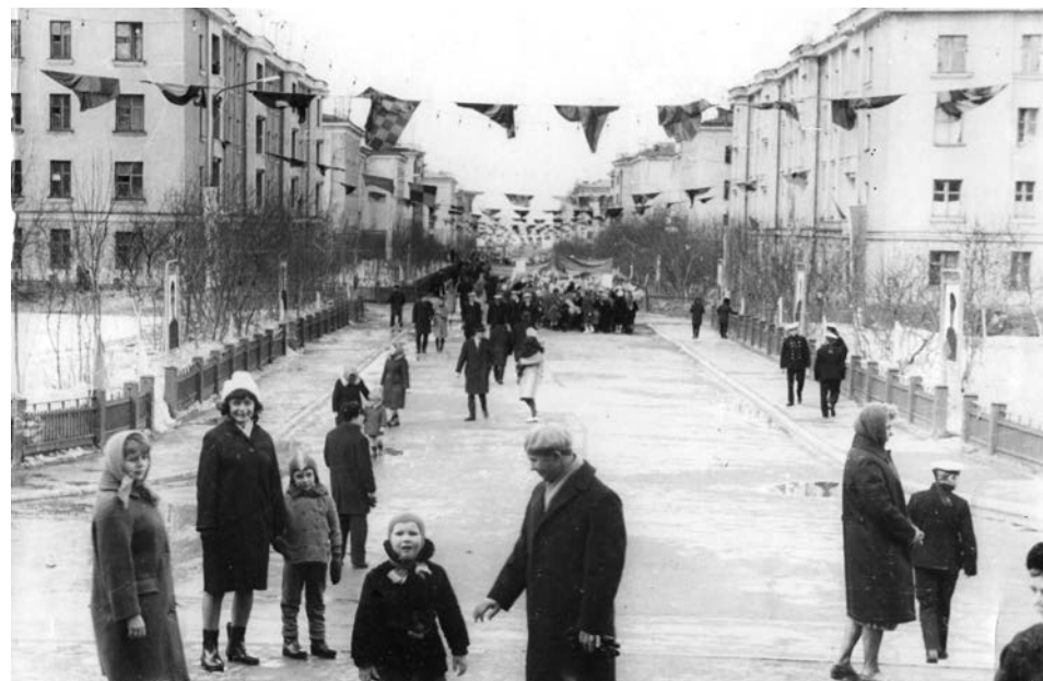
Праздничная демонстрация. Фотоснимок ул.Сафонова 50-60 годов сделан с крыльца ДОФа.