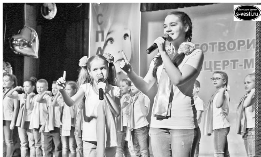
Акция "Спаси ребенка" дает не только шанс на выздоровление больным детям, но и возможность почувствовать поддержку их родителям.