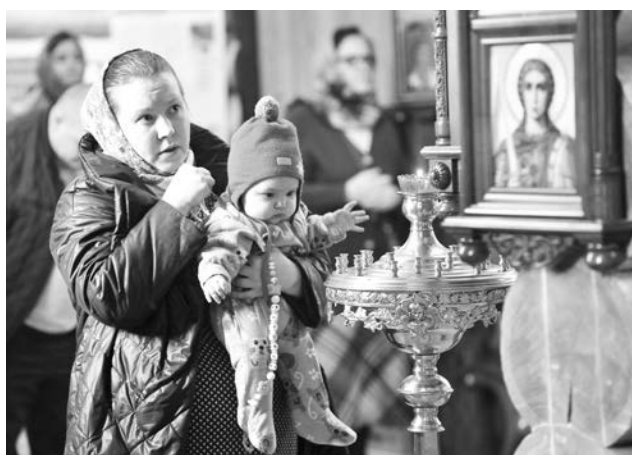
Отрадно, что первая служба нового епископа собрала прихожан всех возрастов.