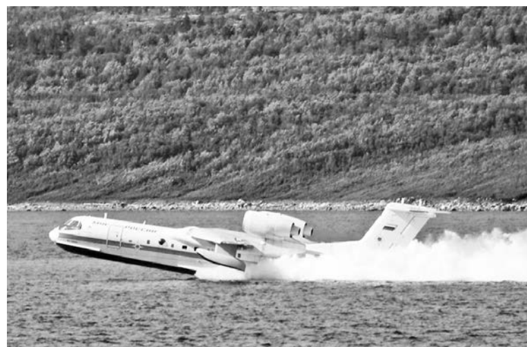
Посадка самолета Бе-200ЧС на воду — красивейшее зрелище.

На сегодня в авиации МЧС России таких самолетов семь. Два из них были направлены в Мурманскую область для участия в исследовательском тактическом учении совместно с силами Северного флота. Важнейшими целями сотрудничества