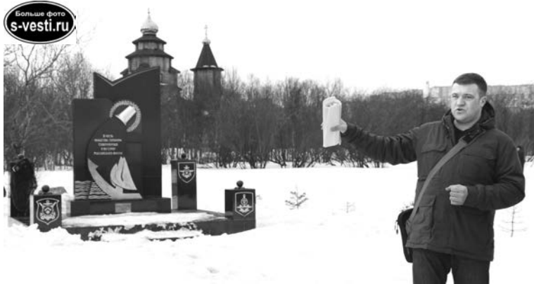
Алексей Сергеев: «На освещение обелиска планируется потратить 90 тысяч рублей».

Всего в ЗАТО будут отремонтированы 9 памятных мест, 7 из них -