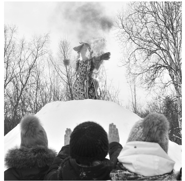
Завершился праздник взятием детворой снежной крепости и сжиганием чучела Масленицы.