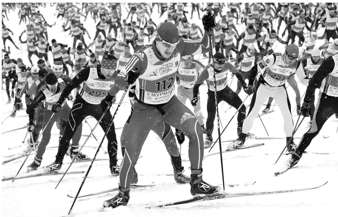
Несколько тысяч северян и гостей Заполярья ежегодно принимают участие в массовом лыжном забеге в Долине Уюта.

Нынешний, 85 Праздник Севера, включает в себя 14 спортив-