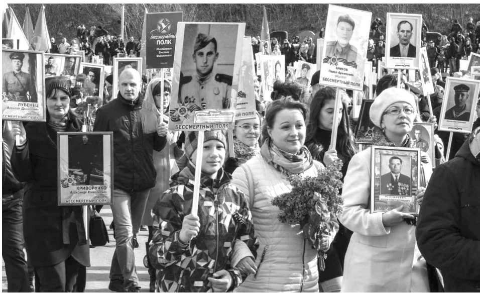
Акция «Бессмертный полк» с каждым годом набирает все большую популярность по всему миру.