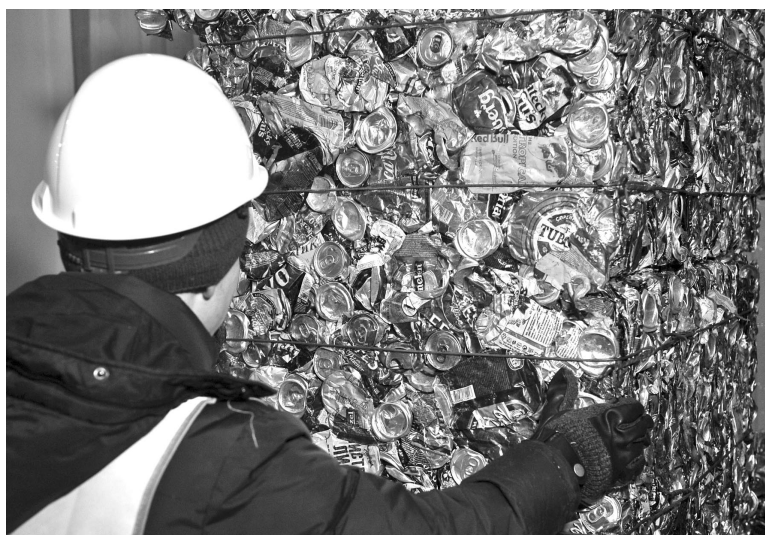
По результатам работы мусоросортировочного комплекса в Междуречье отобрано 76 тонн вторичных материальных ресурсов, из них реализовано 22 тонны.

Этому предшествовала подготовительная работа: еще 13 июня 2013 года АО «Управление отходами» и Министерство природных ресурсов и экологии Мурманской области, действующее на основании постановления правительства Мурманской области, заключили концессионное соглашение на 40 лет. В рамках соглашения АО «Управление отходами» осуществляет строительство и эксплуатацию системы переработки и утилизации (захоронения) твердых коммунальных отходов на территории Мурманской области. Объекты строительства - это полигон ТКО мощностью 250 тыс. тонн/год или 1,25 млн. м 3 /год; мусоросортировочный комплекс мощностью 180 тыс. тонн/год; 4 мусороперегрузочных станции суммарной мощностью 70 тыс. тонн/год. В соответствии с подписанным концессионным соглашением объем инвестиций составит более 1 млрд. 865 млн. руб. Работы по строительству мусоросортировочного комплекса, полигона ТКО и других объектов, составляющих экотехнопарк Мурманской области, завершились в первом полугодии 2018 года. С 1 января