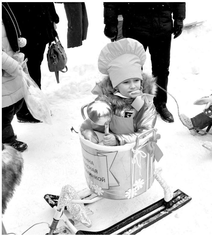
В праздничном шествии приняли участие 9 сказочных детских транспортных средств, в том числе «Манна небесная с изюминкой».