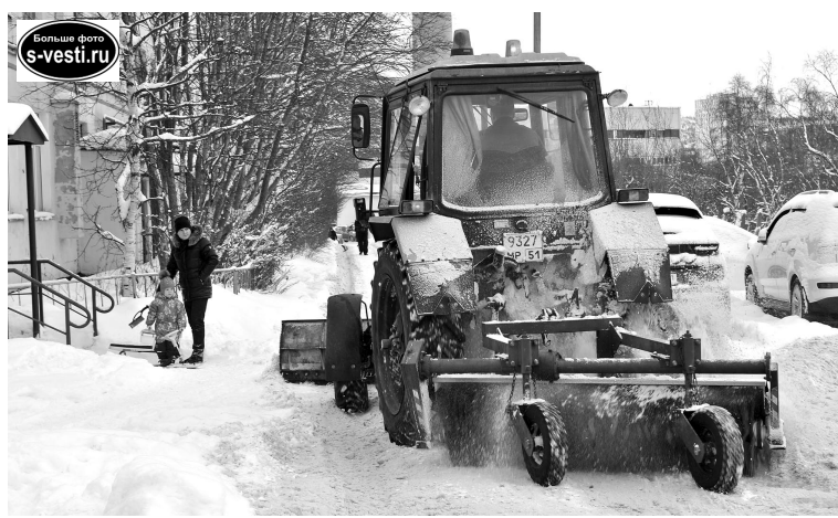
Уборка дворовых территорий - задача УК. Однако от того, как жители подготовятся к механизированной уборке, зависит ее эффективность.