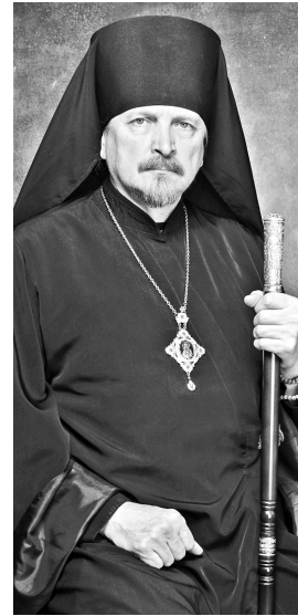
Епископ Мурманский и Мончегорский Митрофан.

Место приема: Общественная приемная партии «Единая Россия» (ул.Сафонова, 13). Предварительная запись по телефону: 4-93-26, 8-(911)-324-24-35.