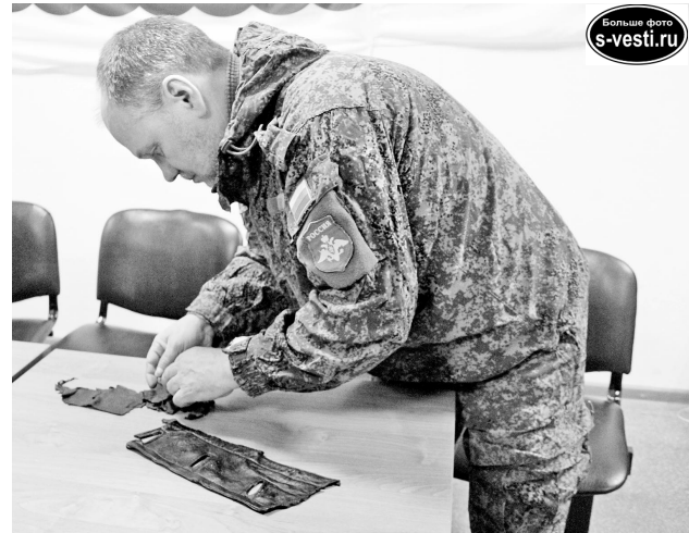
Поисковики демонстрируют часть кожаного реглана и гимнастерки кого-то из летчиков Пе-2.