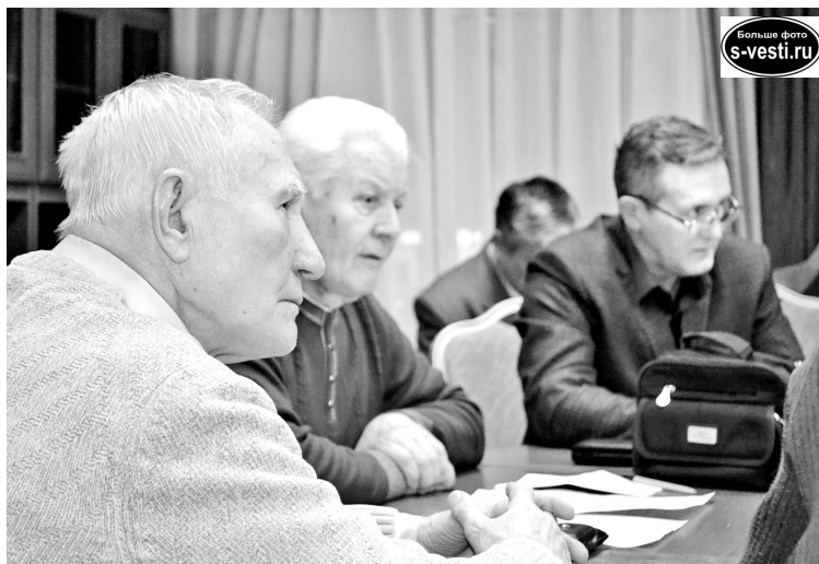
Сегодня в списке на переселение числятся 283 военных пенсионера. Они относятся к первоочередникам, наряду с инвалидами, многодетными семьями и пенсионерами.

лению администрации ЗАТО ежегодно участвуют в семинарах Минстроя РФ, обосновывая необходимость внесения изменений, в этом же направлении работают и на областном уровне в Комитете по вопросам безопасности, военно-промышленного комп-