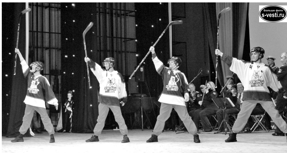
Ансамбль песни и пляски Северного флота поздравил моряков в духе времени, показав на сцене танцевальную хоккейную композицию.