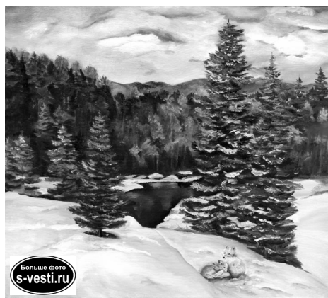
«Приближение весны» (холст, масло), 2017г.