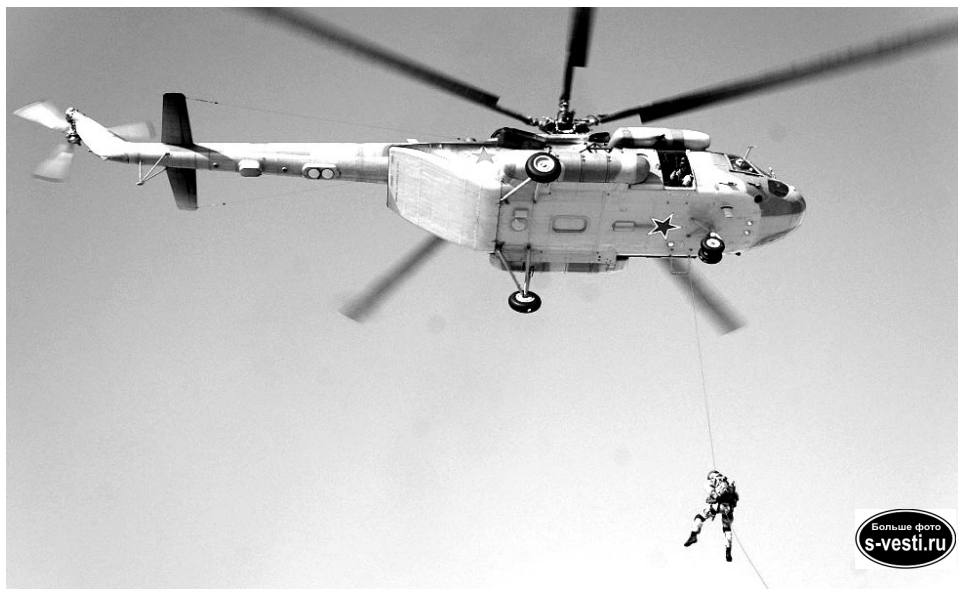
Беспарашютная высадка спецназа с вертолета Ми-8 МТВ-5.