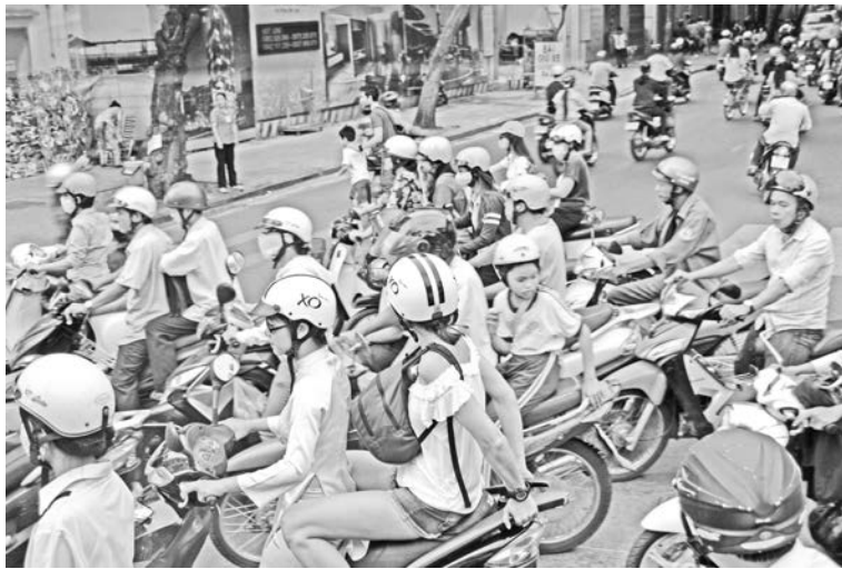
ПДД во Вьетнаме не соблюдает никто.

Не менее удивительны погребальные традиции северных вьетнамцев: умершего хоронят – никаких надгробий не ставят. Через 5 лет откапывают, промывают кости, укладывают в гроб, снова закапывают и только после этого устанавливают надгробия. И если на юге страны захоронения компактные, то на севере – рассредоточены, а вокруг растет рис. Но все вьетнамцы чтят своих предков. Мы проезжали пустующие новостройки: несмотря на острый дефицит жилья, вьетнамцы не хотят заселяться в дом, построенный на месте старого кладбища.