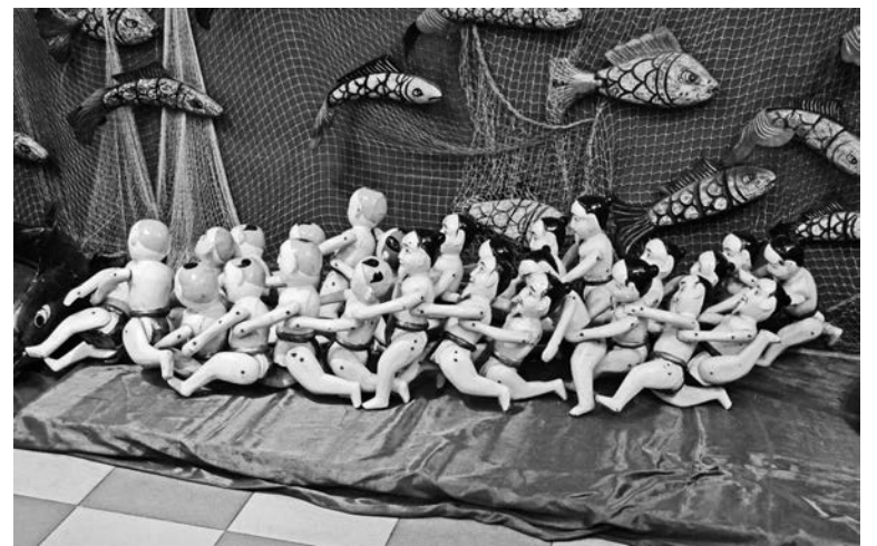
Куклы знаменитого вьетнамского театра на воде.