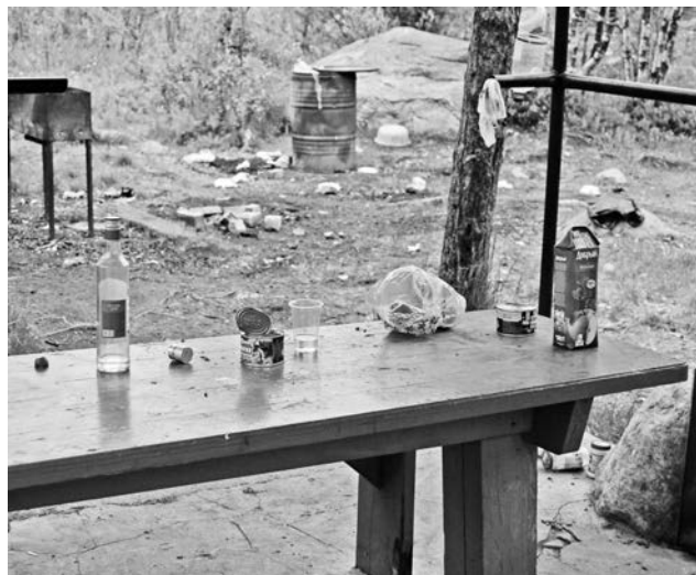
Можно понять, как неприятно видеть такое близким погибшего на этом месте водителя.

Не успели мы отъехать от города, как на обочинах показались кучки строительного и бытового мусора. К сожалению, многие североморцы - и пред-