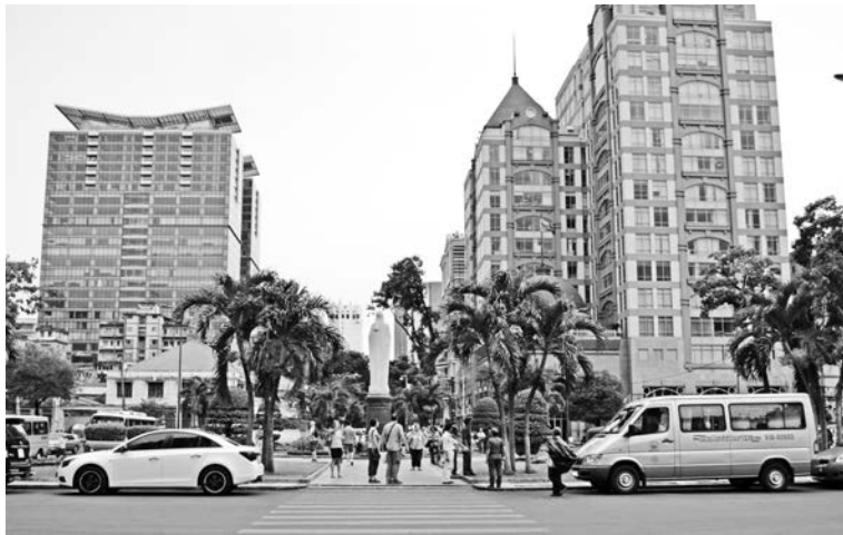
Современный Сайгон – экономическая столица Вьетнама.

Знакомая с бытом вьетнамцев, мы покатались на велорикшах. Надо сказать, кое-что нас удивило. Например, на севере страны все едят на улице. Живут там бедно, комнатки очень узкие – готовить и есть просто негде. Кафе с маленькими стульчиками и столиками тянутся вдоль дороги. В каждом есть аквариумы с живыми крокодилами и разными морскими обитателями – любого можно заказать себе на обед. Только представьте: крокодил на вертеле!