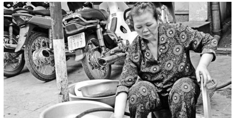
Из-за дефицита жилплощади на юге Вьетнама посуду моют прямо на улице.