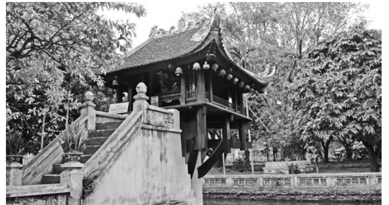
Пагода Чан Куок стоит на одной колонне уже почти тысячу лет.

щие ее последствия, страшно смотреть. Здесь же сидят и вышивают инвалиды войны. Чтобы помочь им, туристы покупают их изделия.