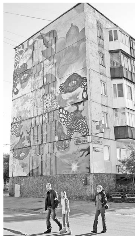
Дом №12 на ул.Советской привнес красок благодаря шведской художнице.