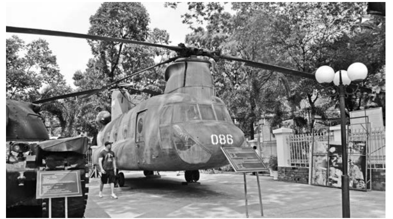
Выставка техники возле Музея реликвий войны в Хошимине.

Далее мы отправились в Хошимин – крупнейший и, пожалуй, наиболее современный город страны, известный как Сайгон. Здесь уже много высотных домов, даже в 68 этажей. Через дорогу не перейти – правила дорожного движения никто не соблюдает: на светофор не смотрят, пешеходов не пропускают, везде пробки. Но самое яркое впечатление от Хошимина – это Музей реликвий войны. На фотографии, иллюстрирую-