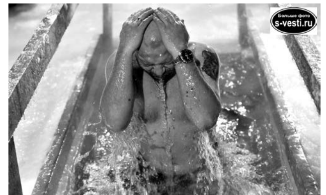
От преодоления себя к блаженству прошли десятки североморцев.

Вскоре выяснилось, что все трое детей играют в команде «Полярные волки». Купание смелых дети-