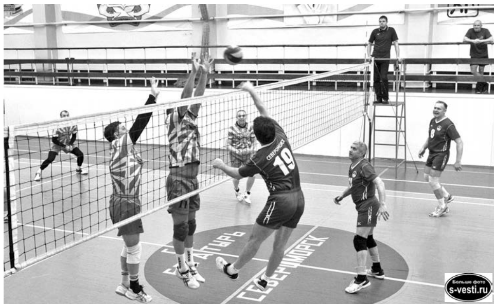
Игровой момент финальной партии между командами «Водоканал» и «Гроза».