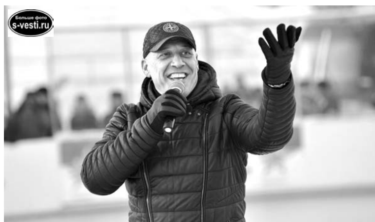
Денис Майданов: «Для артиста большая радость поднимать настроение людям, даже если приходится выступать на льду и в трескучий мороз».

Мастерская игра профессионалов и упорство флотской команды взорвали стадион. Болельщики не скупались на эмоции и криками поддерживали