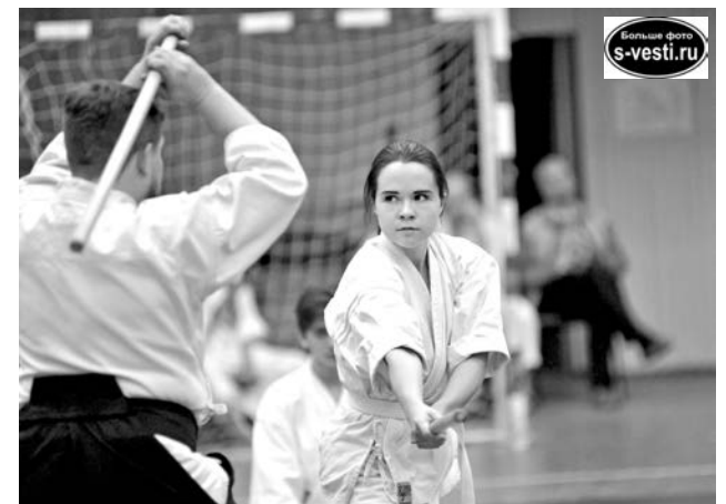
Считается, что айкидо - самый «женский» вид единоборств, что, впрочем, не умаляет его мужественности.