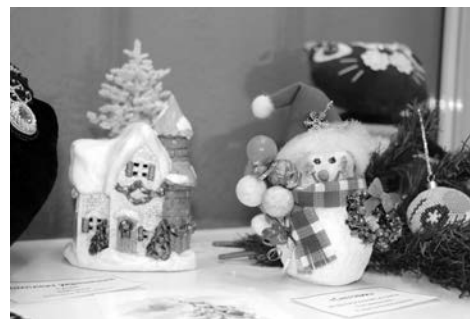
Все работы, представленные на выставке, созданы в этом году.