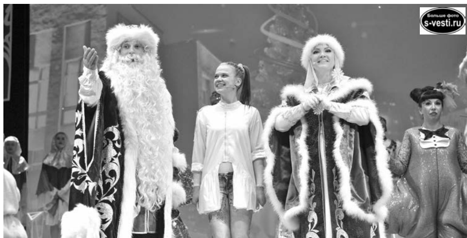
Девочка Саша не верила в чудеса, но, очутившись в сказке, поняла, что на Новый год они происходят.