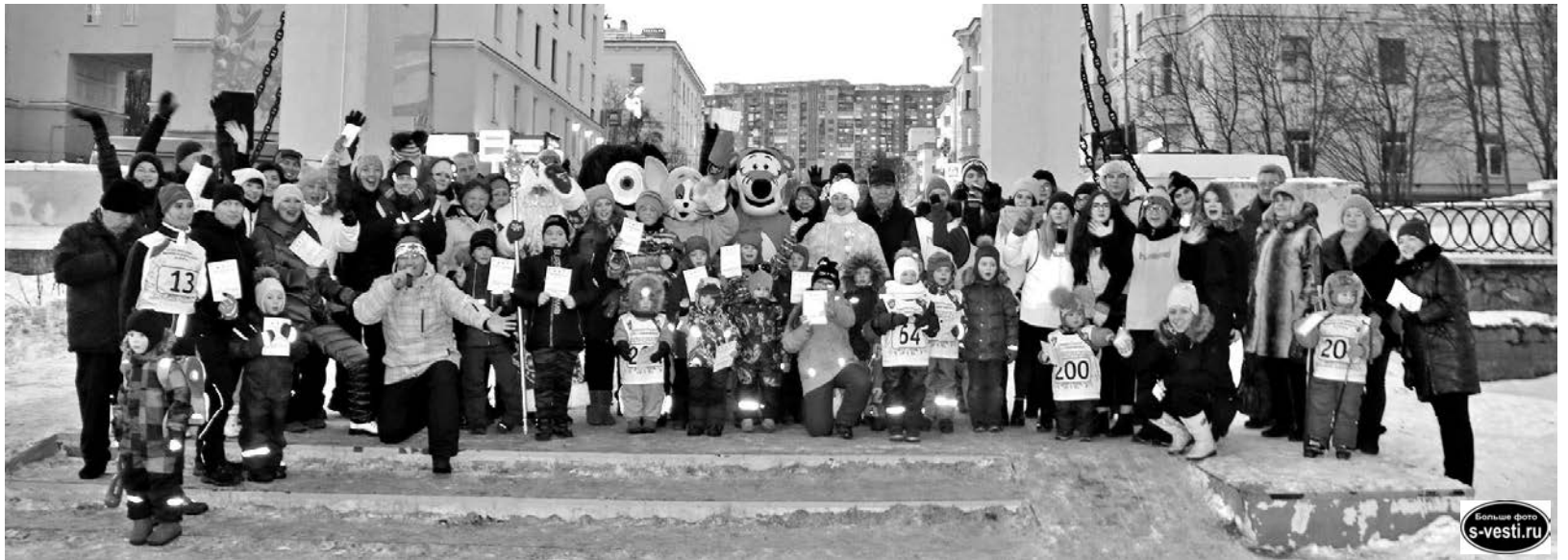
Лыжные прогулки на Аллее спорта, возможно, для кого-то станут стартом спортивной карьеры, а для кого-то - доброй семейной традицией.