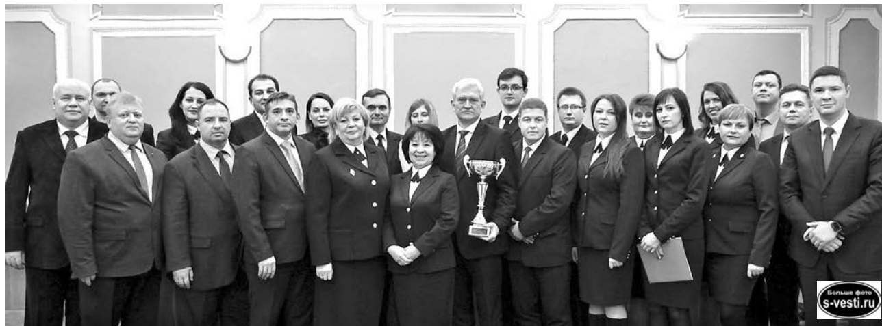
Коллектив Североморского ГВС вновь стал лучшим.

Военными судами была удовлетворена четверть заявлений, а год назад - почти половина из них, что свидетельствует об уменьшении нарушения