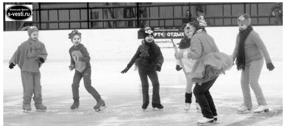
Как и заведено в сказках, добро и радость победили: задорные танцы на льду подарили праздничное настроение не только главным героям, но и всем гостям.