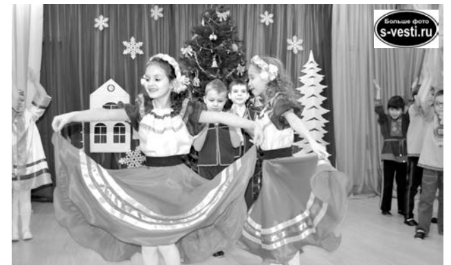
Полные фоторепортажи со всех новогодних утренников ищите на сайте s-vesti.ru

Открыли праздник яркие, зажигательные мексиканские танцы, ребята с бубнами и маракасами, да еще в компании с Кактусом, повеселили гостей. Затем на импровизированную сцену вышли индейцы: оседлав коней, они исполнили свой танец. Представители северных народов окончательно растопили лед, скользящий по земной шару, и открыли дорогу Деду Морозу, уже спешащему на праздник с мешком подарков. В финале представления каждому малышу достался заветный сладкий подарок от главного новогоднего волшебника.