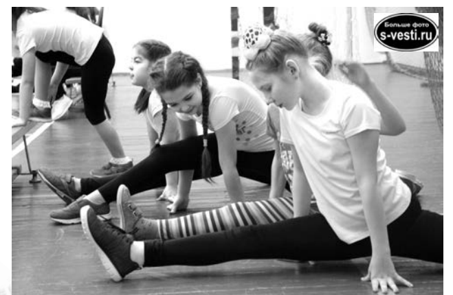
Участницы соревнований готовятся сдавать дисциплину «шпагат».