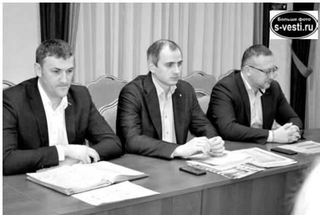
Руководство и представители АО «МЭС» - частые гости ЗАТО Североморск.

- В Североморске за всю историю центрального отопления теплотребление никогда не настраивалось, дома потребляли столько тепла, сколько им хотелось, люди жили при температуре в квартирах +28, а платили по нормативу значительно более низкому, чем реальное потребление, - сказал глава ЗАТО. - После установки ОДПУ и переводе расчетов с норматива на реальное потребление цена вопроса подскочила - и разницу между нормативом и фактом потребления пришлось оплачивать гражданам. После того, как мы начали регулировку тепла, где-то снизилась подача теплоносителя в МКД и мы столкнулись с тем, что отдельный дом сам по себе настраивать невозможно, надо перенастраивать весь тепловой микрорайон. В нашем случае - это 9-й микрорайон. Грубо говоря, можно на ул. Падорина, 23, поставить шайбу - и у них