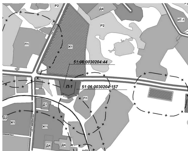
Приложение №2 К Решению Совета депутатов ЗАТО г.Североморск от 25.12.2018 №454

Приложение №1 К Решению Совета депутатов ЗАТО г.Североморск от 25.12.2018 №454