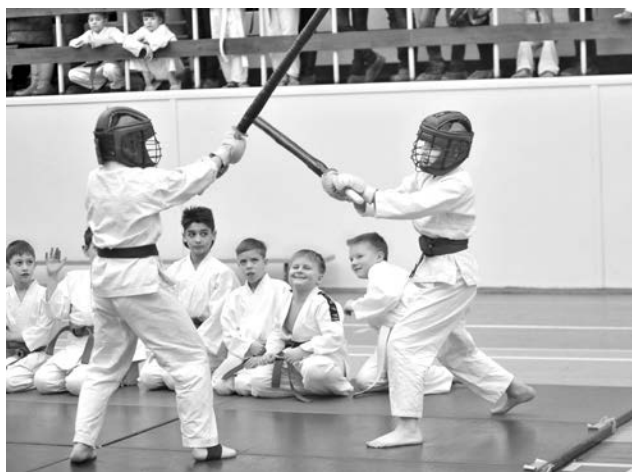
Работа с оружием - вспомогательный раздел айкидо, необходимый для отработки культуры передвижений, работы рук.

фликтности, во-вторых, во избежание травм (чтобы не пришлось ограничивать применение техник).