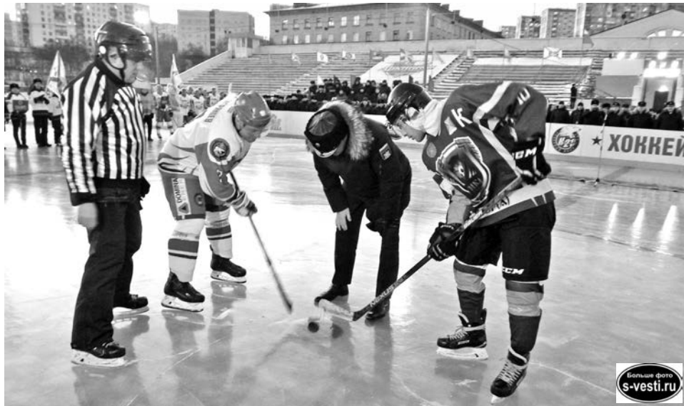
Первое вбрасывания в новом сезоне провел командующий Северным флотом адмирал Николай Евменов.