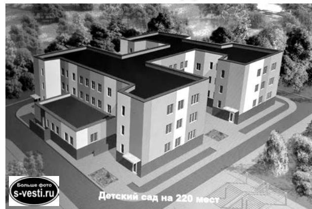
Около 60% всей площади застройки будет отдано под озеленение.

О технических нюансах и проекте дошкольного учреждения присутствующим доложили представители АХТО и КИО. Помимо строительства самого здания