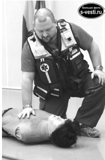
Каждый человек должен обладать навыками оказания первой медицинской помощи.