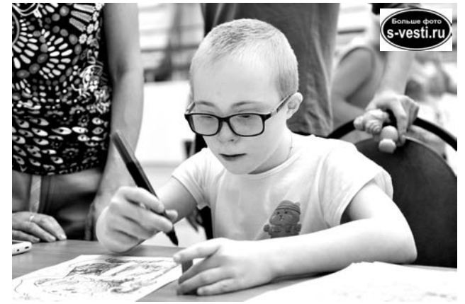
Настоящая тренировка для непослушных пальцев - раскрасить новогоднюю открытку для мамы.