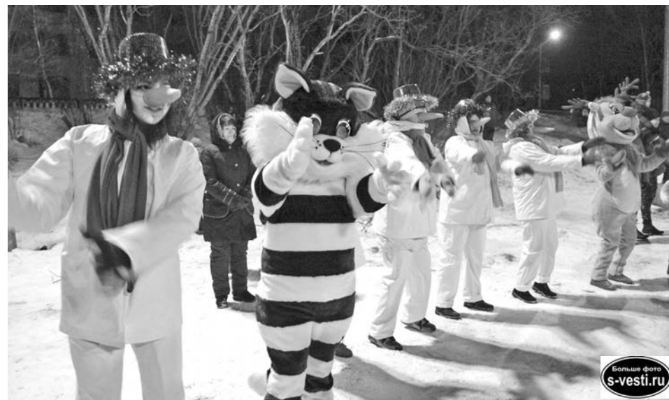
Аниматоры ЦДМ и сами, энергично двигаясь, грелись, и помогли согреться гостям праздника.