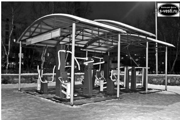
Не дождавшись открытия, североморцы уже опробовали тренажерную площадку.