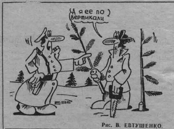
Рис. В. ЕВТУШЕНКО.