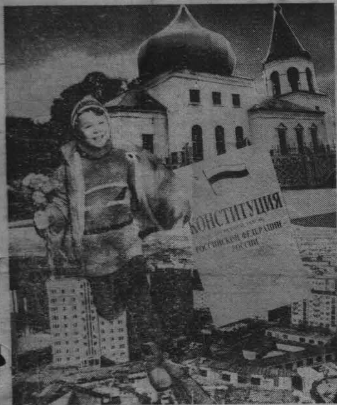
Фотомонтаж Л. Федосеева

12 декабря 1993 года всенародным голосованием была принята КОНСТИТУЦИЯ РОССИЙСКОЙ ФЕДЕРАЦИИ