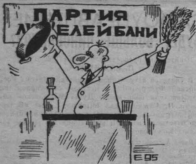
«Есть такая партия!»