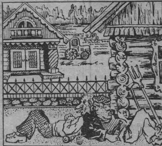
Письма на это кулачке. У людей выходной, а он все пашет. Рис. В. ЕВТУШЕНКО.