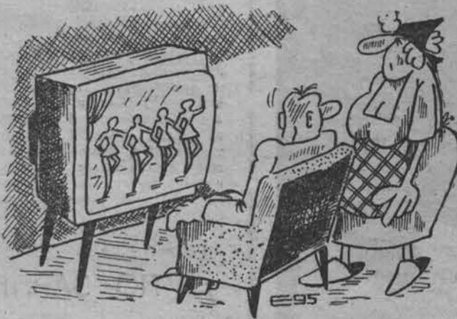
Опять «Лебединое озеро» показывают, включи-ка, мать, радио...