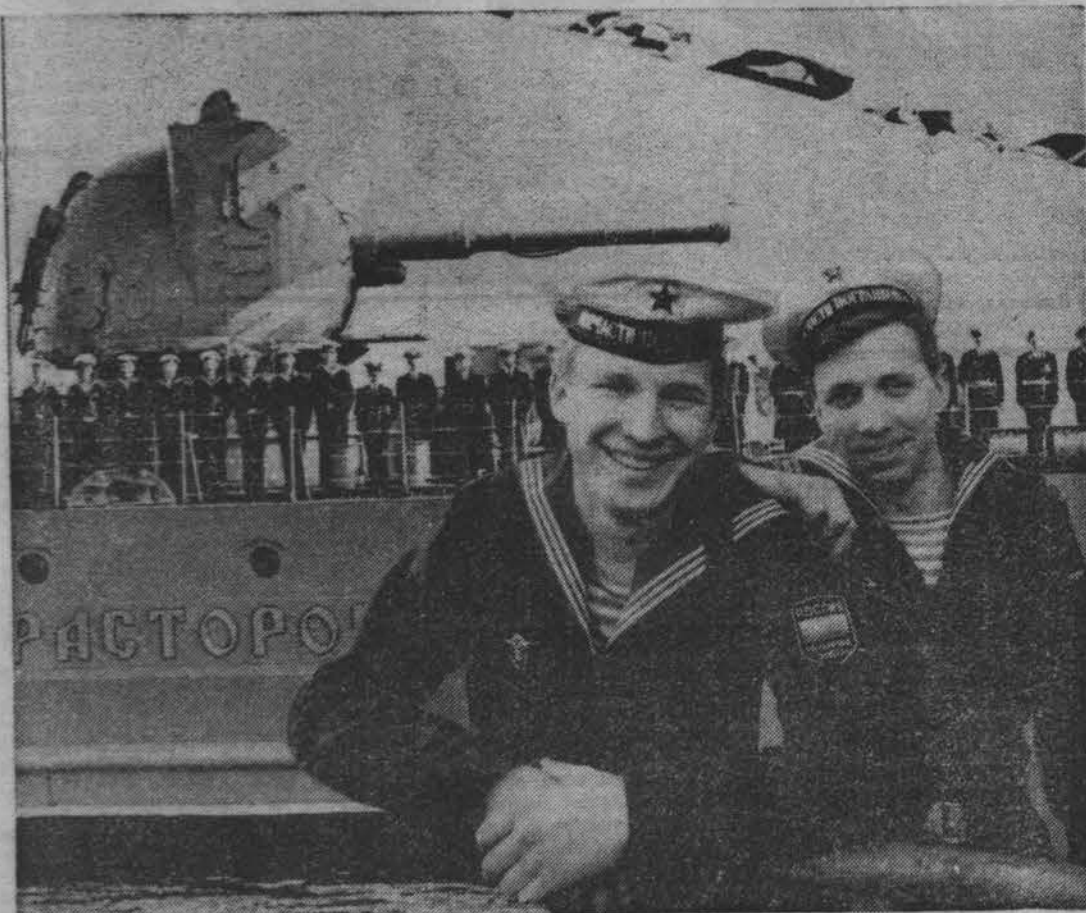
В праздничный день.

Примечание. За безбилетный проезд взимается штраф в размере 10000 За неоплаченный провоз багажа штраф в размере 8000