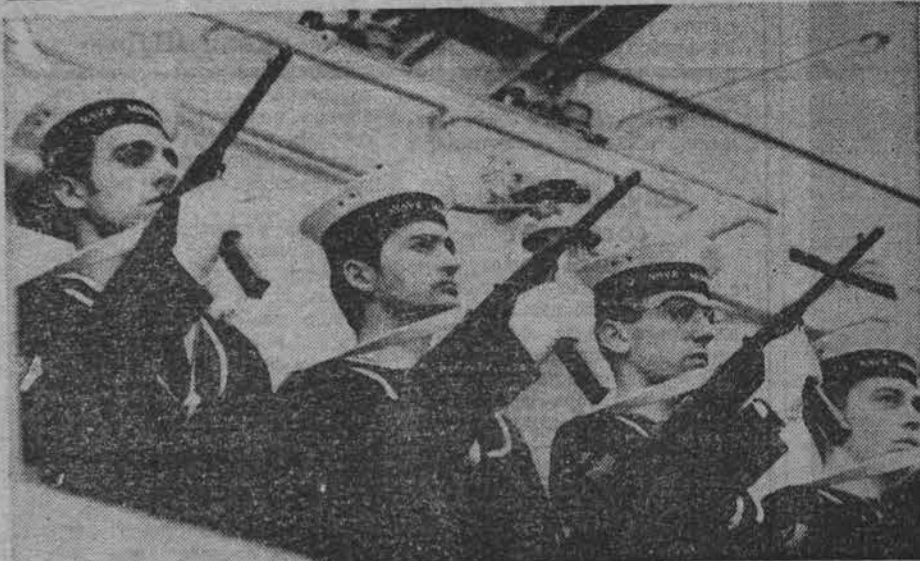
Визит итальянских кораблей в Североморск стал знаменательным событием в жизни города, который, кажется, начинает привыкать к иностранной речи на своих улицах. Жители столицы Северного флота показали себя гостеприимными хозяевами, во всяком случае, таково мнение итальянцев. Хорошее впечатление оставили посланцы далекой южной страны: скромные, вежливые, доброжелательные.