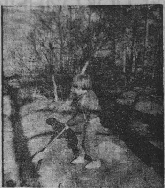
У озера Домашнего.