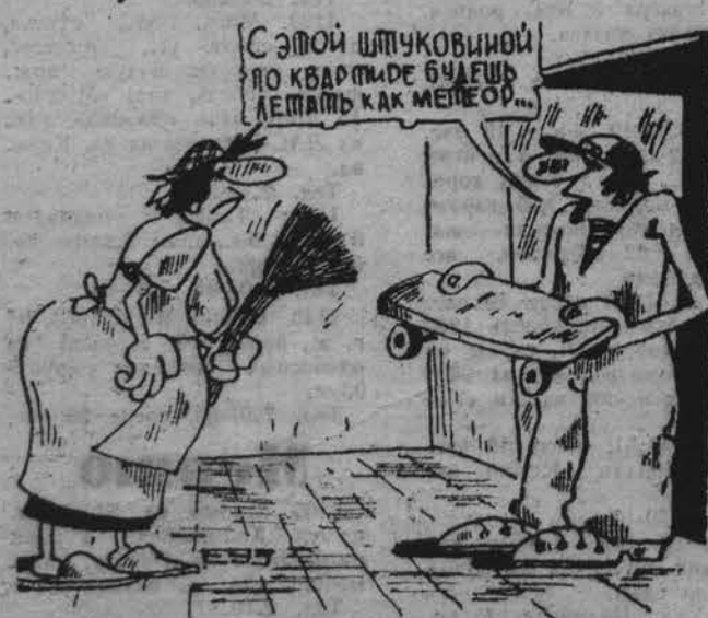
Рис. В. Евтушенко.