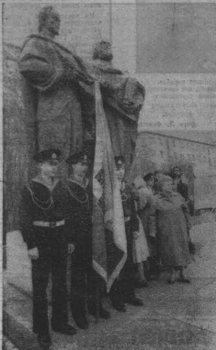
Праздником национальной духовности пазыдают День славянской письменности, который ежегодно отмечается в различных городах страны. А родился он — на мурманской земле, при участии местных писателей. На снимках: фрагменты праздника.