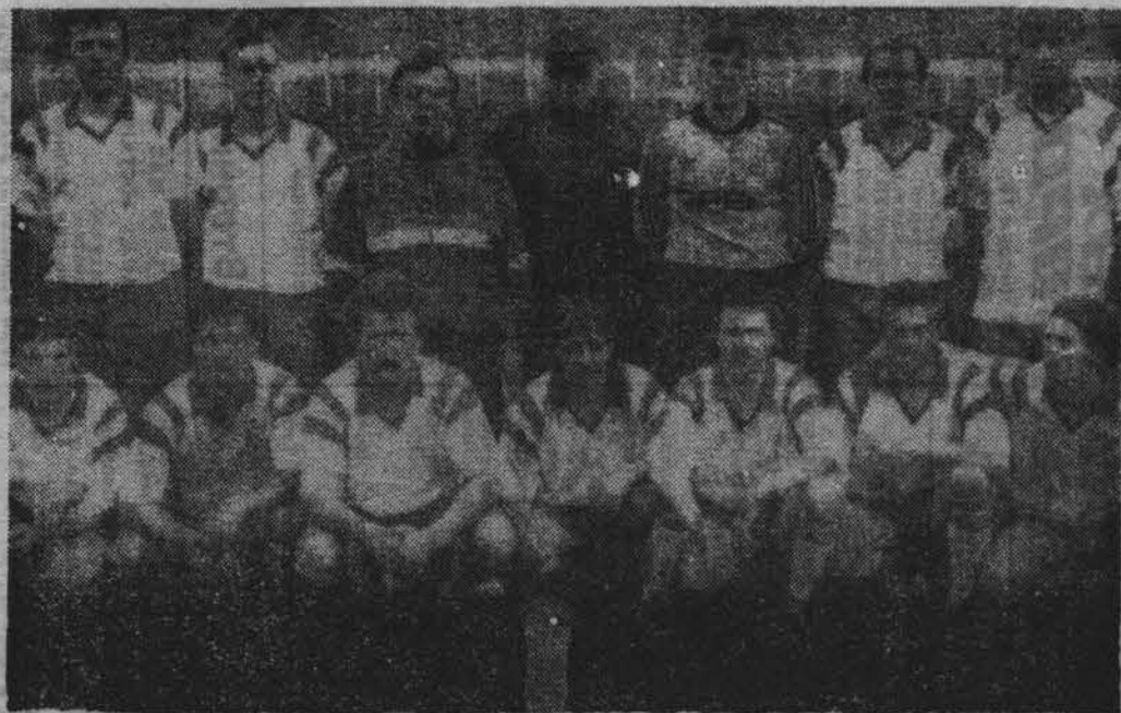
На снимке: обладатель Кубка Победы сезона 1995 года футбольный клуб «СКФ—Рена».