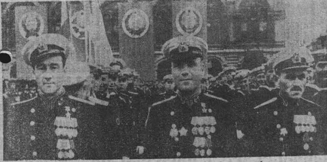
Североморцы на Параде Победы.