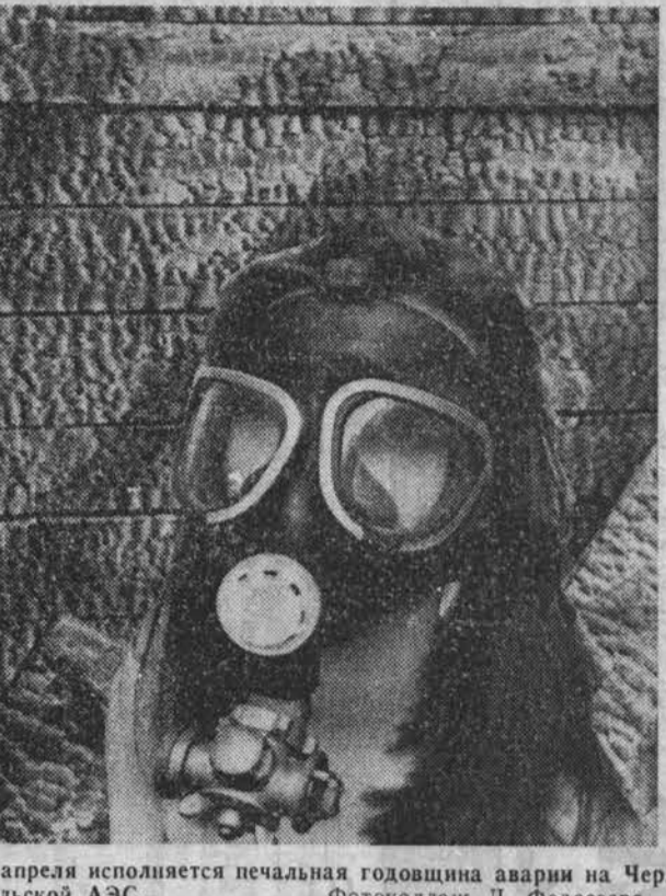
26 апреля исполняется печальная годовщина аварии на Чернобыльской АЭС...

С. ПЛУЖНИКОВ, С. СОКОЛОВ. «Комсомольская правда».