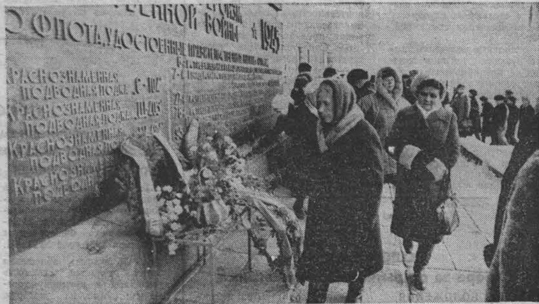
Участники IV областного слета клубов ветеранов войны возлагают цветы к памятнику Героям-североморцам.