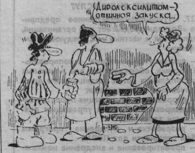
Реклама и жизнь.