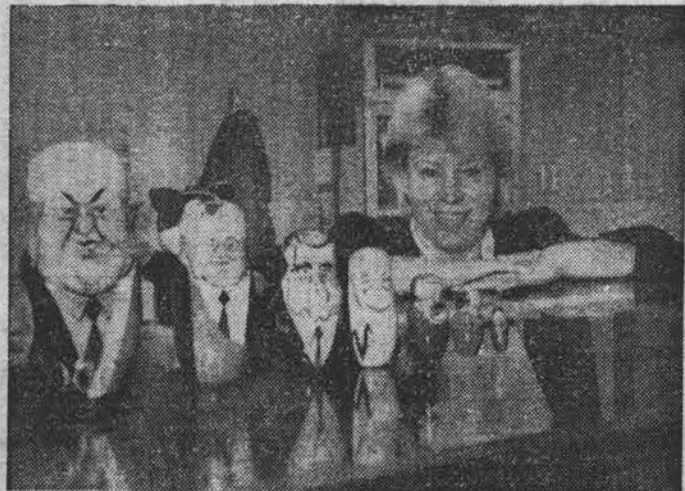
(Окопание. Нач. на 1-й стр.)

Во всяком случае, мы с удовольствием осваивали великолепное кухонное оборудование.