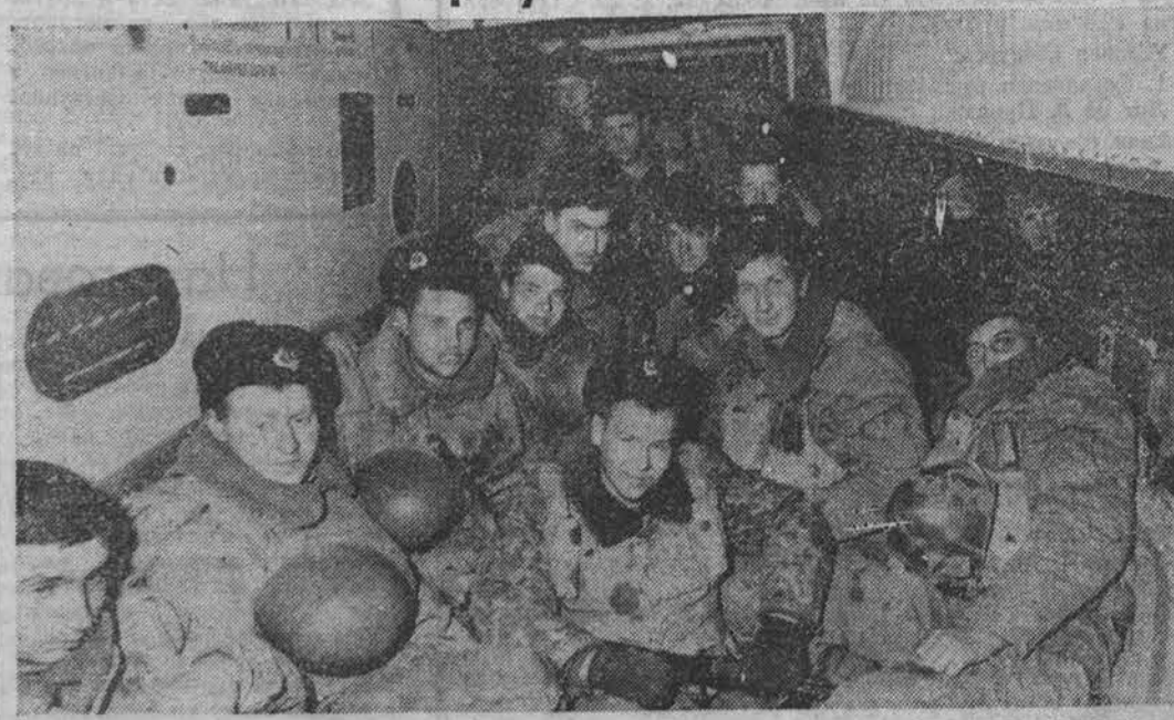
Морские пехотинцы Северного флота, участники восстановления конституционного порядка в Чечне, возвратились в часть.