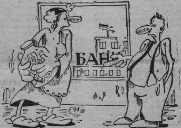
А моя банка надежнее твоего банка.