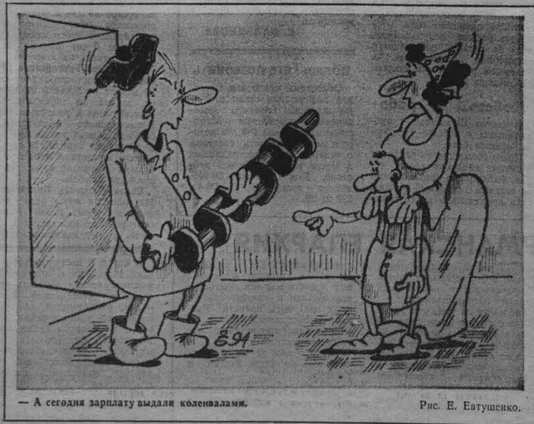
— А сегодня зарплату выдали коленалами.