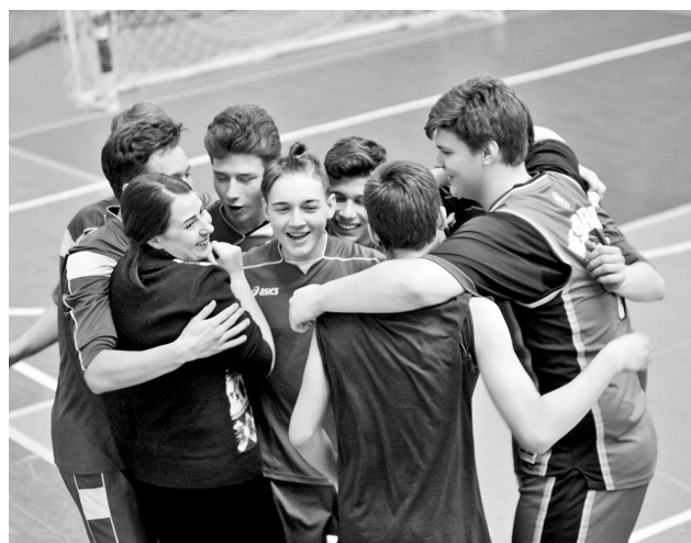
Радость команды «Тайфун» – обладателя кубка СК «Богатырь» по волейболу.

У юношей матчем за 3-е место стало противобор-