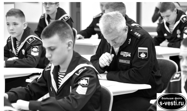
Командующий Северным флотом наравне с нахимовцами трудился над поиском правильных ответов.