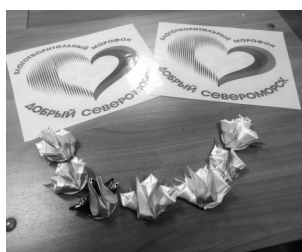
Броши в технике канзаши.