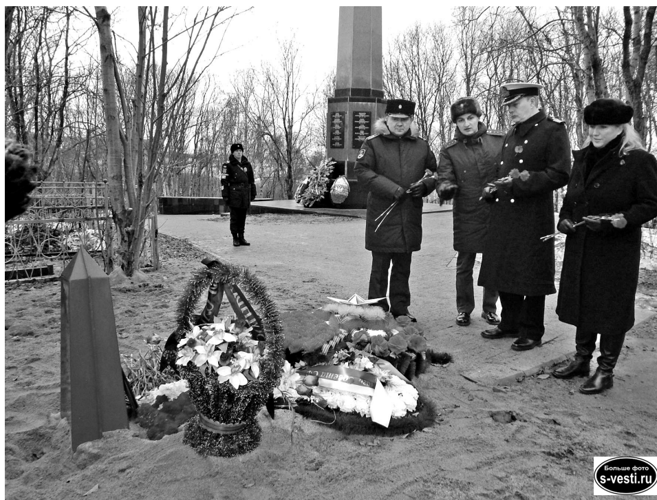
Представители иностранной делегации возложили цветы к недавнему захоронению советского экипажа бомбардировщика Пе-2.

– Для нас большая честь побывать вновь на мурманской земле, так как здесь наши воины вместе сражались против общего врага, – сказал военно-морской аташе при Посольстве Великобритании в