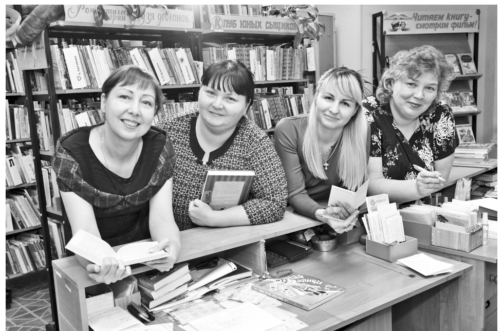
Оказавшись «на Сизовке» в обществе таких обаятельных библиотекарей, возьмишь книгу, даже если не собирался.

свежие журналы, газеты. Библиотека, как и прежде, позиционирует себя площадкой для общения и творчества, проводя презентации книг, мастер-классы, устраивая выставки. Братским народам посвящена музейная композиция «Мы – славяне: Россия, Беларусь, Украина», ведь Североморск – город многонациональный. Есть ноутбуки и бесплатный интернет, а также платные услуги, например, для детей силами библиотекарей можно организовать проведение дня именинника.