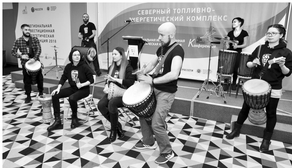
Рабочий ритм задали участникам «СевТЭК-2018» музыканты студии этнических барабанов «Drum Tam Tam».