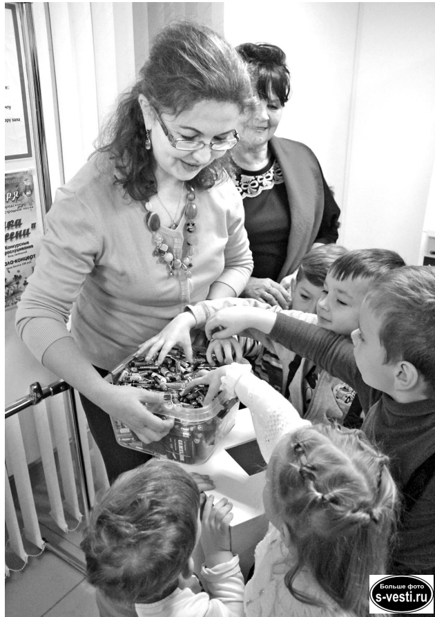
Малыши в детском саду уже знают, что место отработанных батареек - в специальном боксе. А вы в курсе?

12 ноября в МФЦ состоялся заключительный этап акции – опускание взрос-