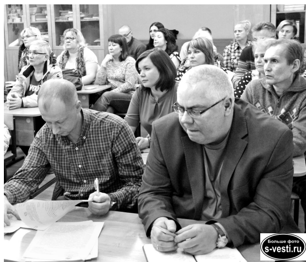
Жители п. Сафоново дали свои наказы представителям городской администрации и ЖКХ.