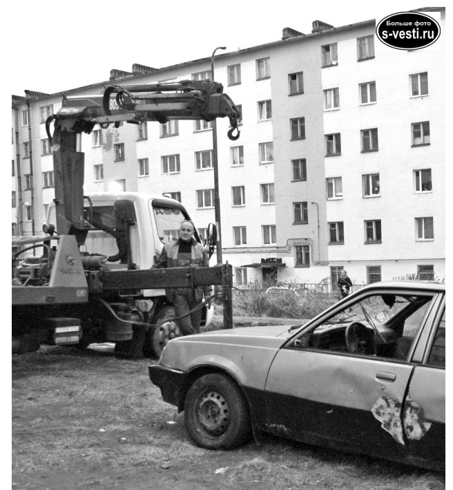
32-й в этом году разукомплектованный автомобиль вывезен с ул.Пионерской.