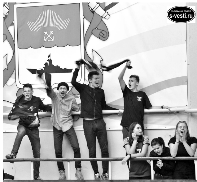
Решающие матчи турнира проходили под невообразимый рев трибун.