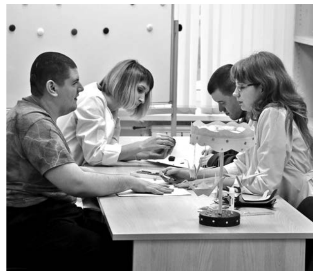
В Отделении дневного пребывания молодых инвалидов всегда есть время для творчества.