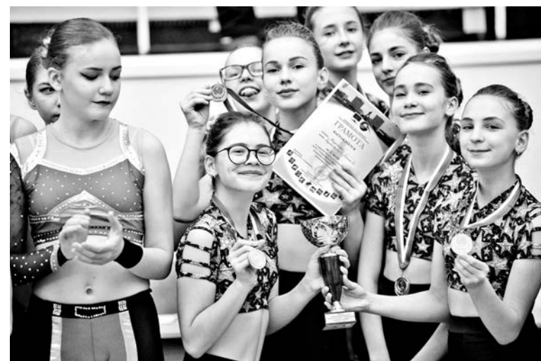
Команда ДЮСШ-3 «Надежда» в очередной раз удержала лидерство на областном уровне.

- Мы на каждом соревновании стремимся стать победителями,