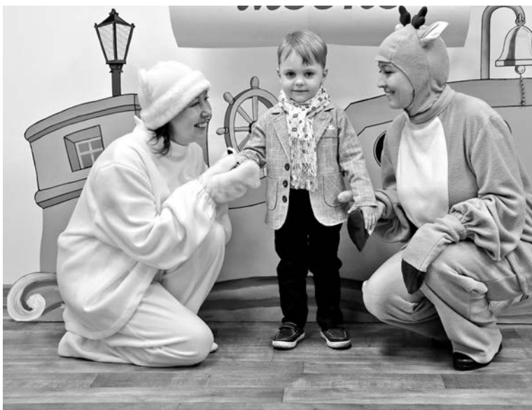
В холле научной библиотеки для посетителей праздника работала фотозона.