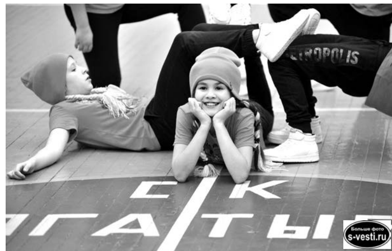
Дисциплина «Хип-хоп» появилась в фитнес-аэробике как возможность подросткам проявить себя в этом виде спорта.