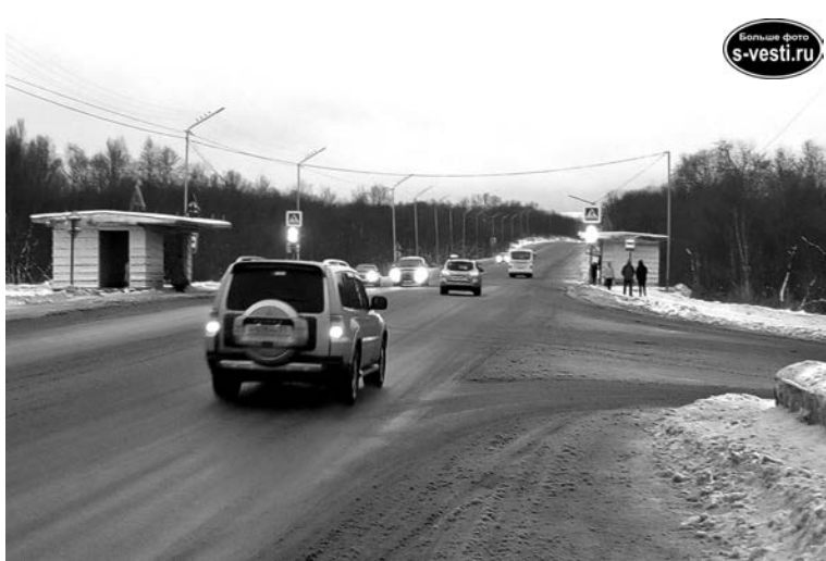
Установка дополнительного светофора на выезде из п.Сафоново на Мурманское шоссе признана неактуальной.

Муниципальные органы, проводя комплексное дорожное обследование, внесли предложение по реконструкции пешеход-