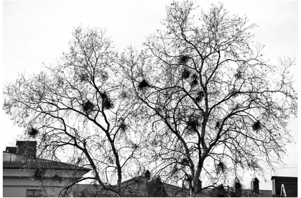
Заболевшее дерево в городском парке.

По иной версии, причина кроется в поражении растения особыми группами бактерий - фитоплаз-