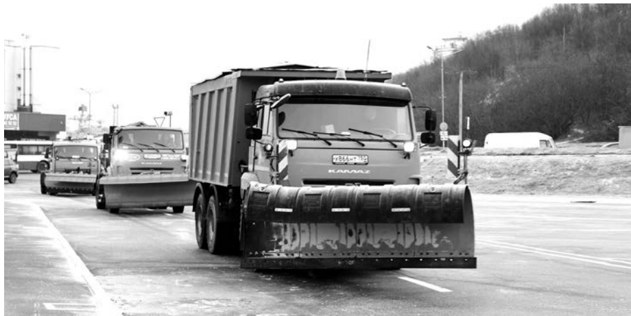
Этой зимой подрядчику не придется брать часть снегоуборочной техники в подряд и субподряд у других организаций.