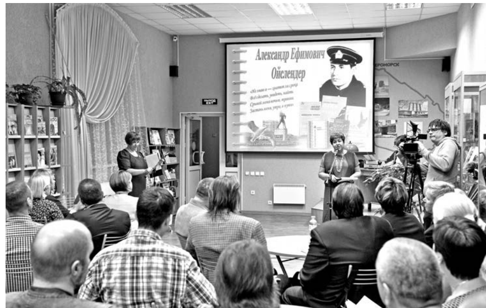
На стихи А.Ойслендера написаны известные фронтовые песни «Два товарища» и «Тельняшка».