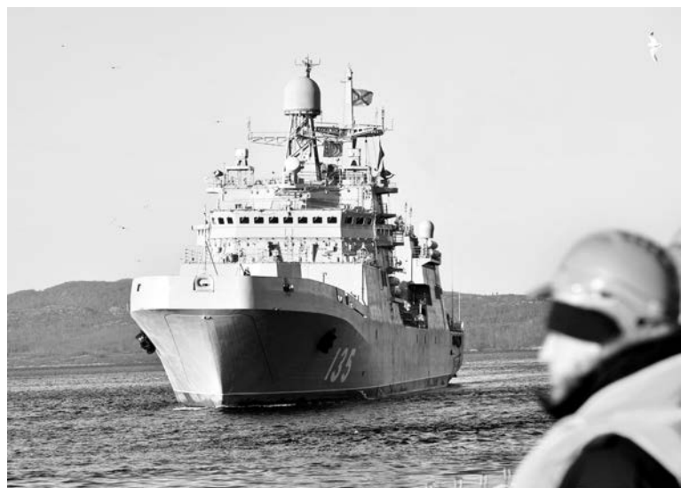
Большой десантный корабль «Иван Грен» впечатляет своими внушительными размерами.