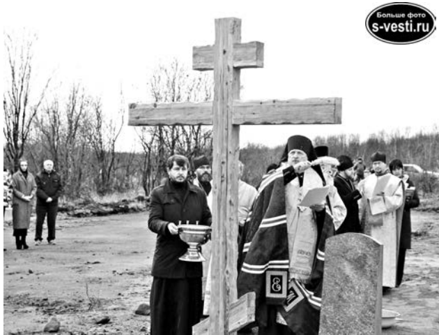
Заложение камня в основание храма и освящение креста на месте будущего престола.

- Духовная поддержка воинов - основная задача, ради которой, по мысли святейшего Патриарха Московского и всея Руси Кирилла, создавалась наша Североморская епархия, - говорит епископ Североморский и Умбский Митрофан. - Без духовной поддержки и крепости воинов-североморцев трудно решать те чрезвычайно важные задачи, которые стоят перед Северным флотом.