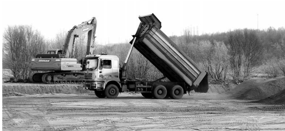
Чтобы поднять уровень грунта до 2,2 м на городском кладбище, было завезено 4700 кубометров песка.