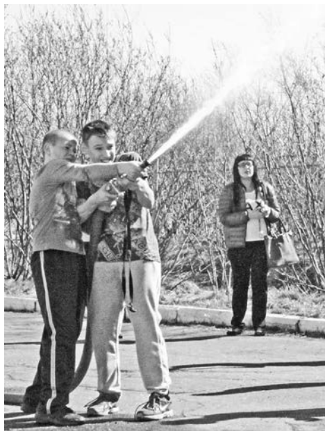
Совладать с рукавом вдвоем с напарником оказалось не так сложно, ведь этому предшествовали многие часы практических занятий в пожарной части.