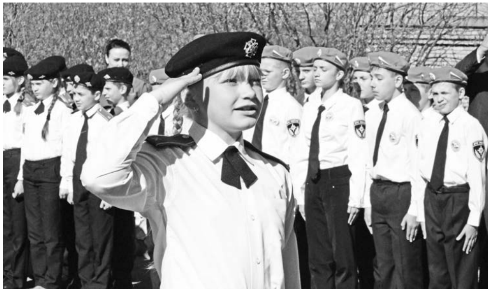
Носить гордое звание кадета МЧС сегодня стремится все больше девочек.

– Как девчонка боевку-то надевает! Лучше пацанов справляется! – такие слова от настоящего пожарного для хрупкой шестиклассницы – лучшая похвала. Это ведь не просто практическое занятие, а тематический сбор кадетов МЧС со всей области, своеобразный годовой экзамен для учеников кадетских классов.