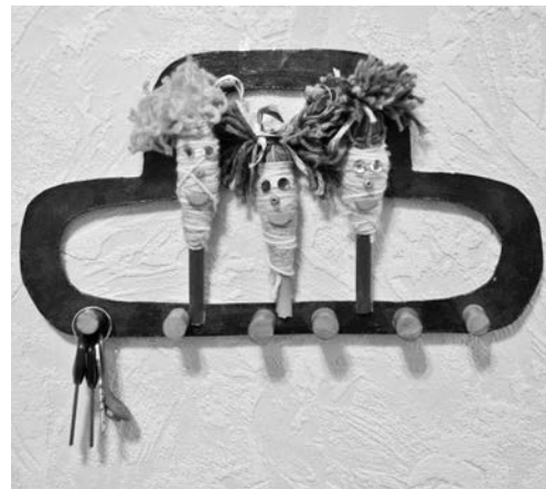
Вот такую забавную ключницу Илья Степанов сделал из остатков пряжи, старых фломастеров и фанеры! И красиво, и функционально!