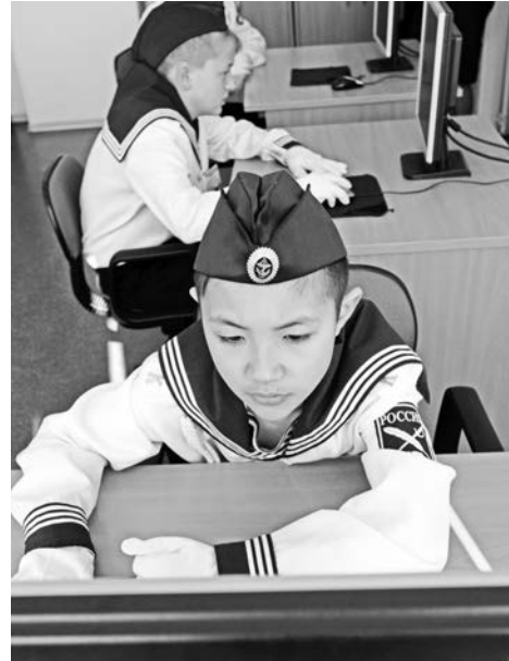
Кадеты признались, что для подготовленных справиться с тестовыми заданиями не составило особого труда: варианты действий в чрезвычайных ситуациях они знают наизусть.