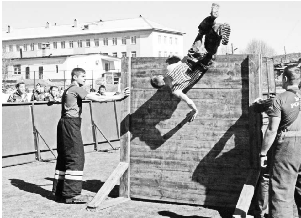
Тому, с какой легкостью кадеты перепрыгивали через стену, удивлялись даже сами спасатели.