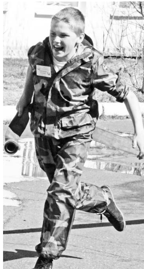
Пожар условный, поэтому тушить его бежали с радостью.