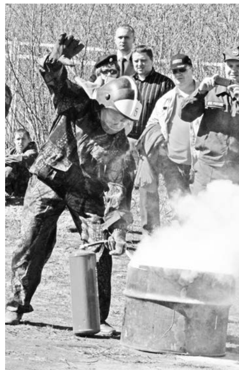
Устранение очага возгорания – последний этап пожарной эстафеты.