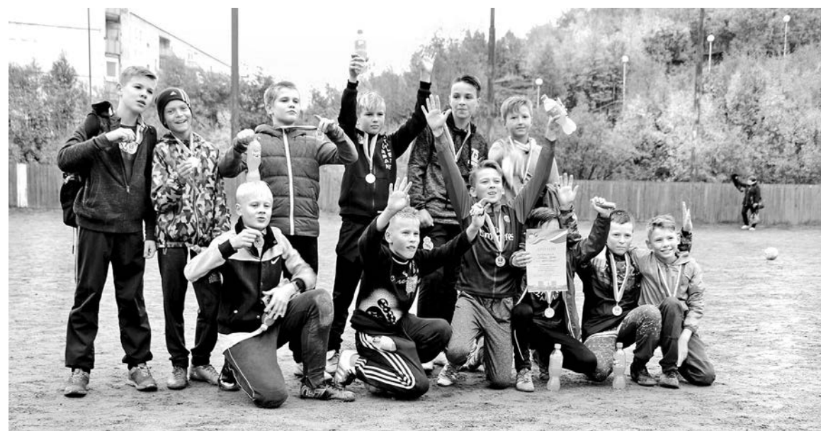
Команда 5-6 классов гимназии №1 боролась за победу до последней минуты.