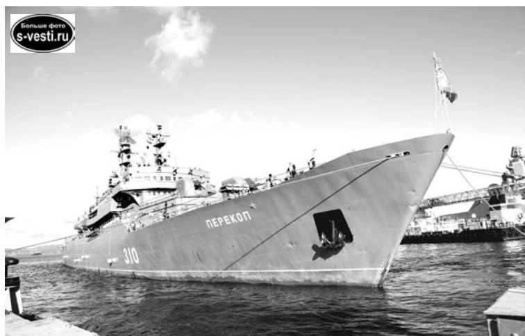
В Североморске учебный корабль «Перекоп» ошвартовался впервые.

Морская практика нахимовцев завершилась на Камчатке, а курсанты продолжили межфлотский