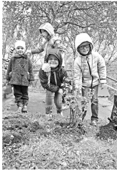
Эко-традиции поддерживает каждое новое поколение д/с №8.