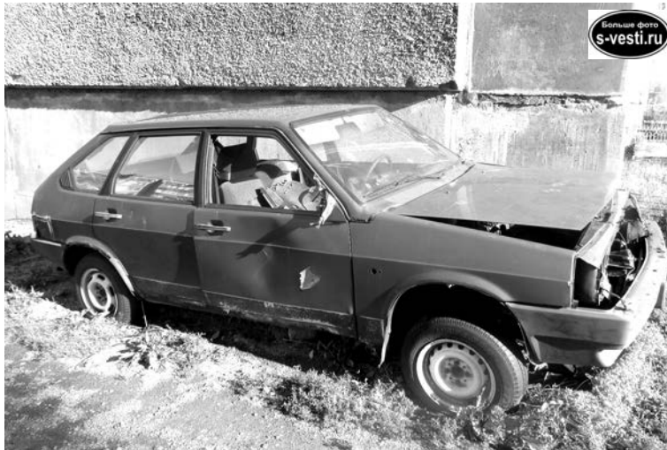
Автохлам на улице Инженерной.

привлекаться хорошо знающие свой район участковые уполномоченные. Сотрудничество ГИБДД и администрации города станет более тесным. Интенсивность работы комиссии заметно повысится, отныне она станет собираться дважды в месяц.