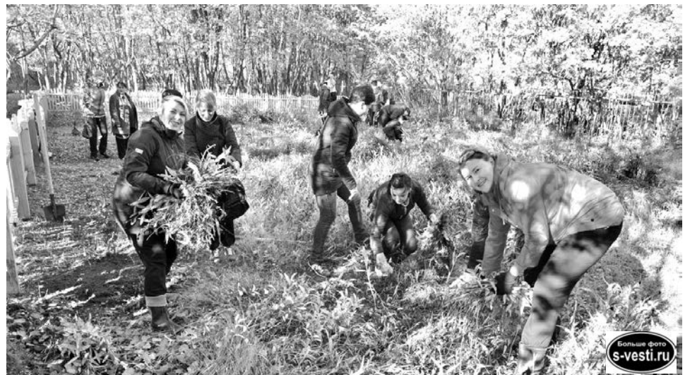
Активисты СШ №9 из 8«Б» и их родители совместили озеленение и субботник.