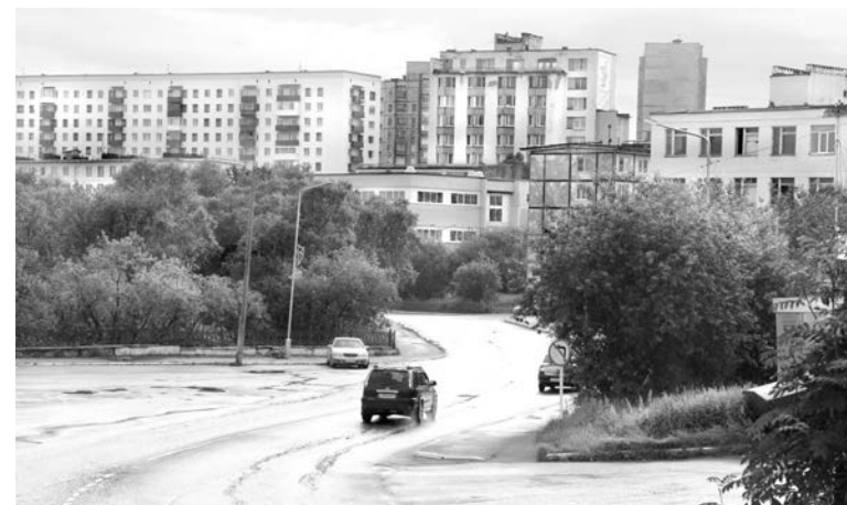
Нынешняя разметка на участке дороги возле городского парка вызывает недоумение у многих водителей.