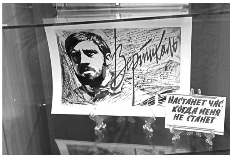
Плакаты на выставке отражают и личные предпочтения коллекционеров.

В минувшее воскресенье в Североморской городской библиотеке-филиале №2 (ул.Фл.Строителей, 5) открылась выставка «История России на плакате».