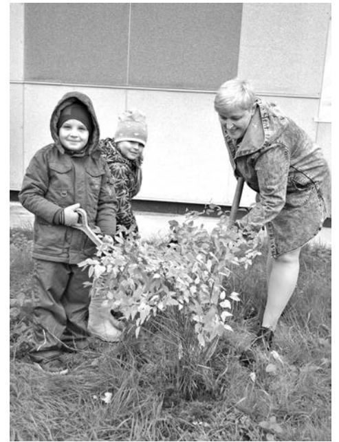
Новый д/с №15 на стартовых позициях по благоустройству территории.