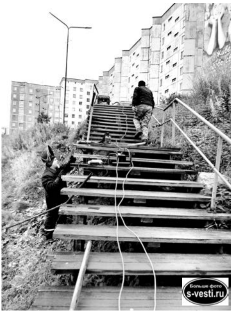
Трап на ул.Сизова частично отремонтировался не раз - металлические и деревянные заплата видны повсюду.