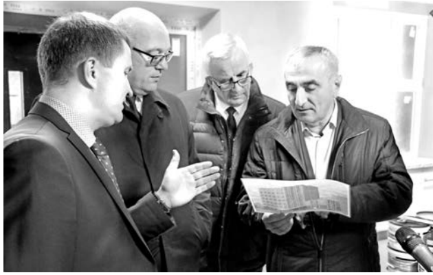
Участники встречи закрыли вопрос по обустройству колясочной и входа в поликлинику.

когда у заинтересованных сторон были разные мнения по поводу определенных работ, что оставляло движение вперед. Но благодаря нашим совещаниям появляется общее видение,