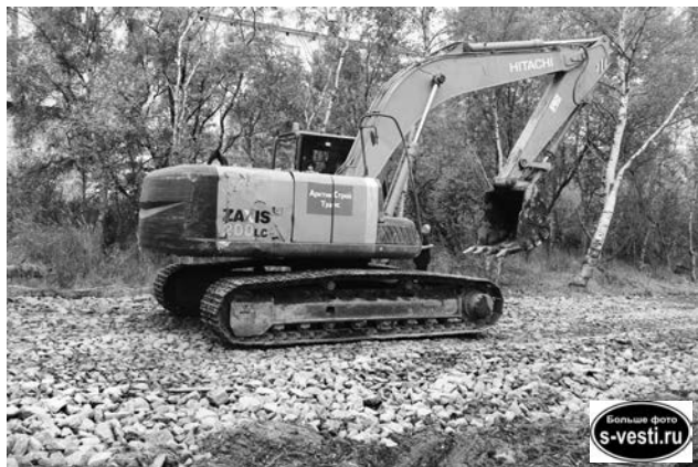
Под Аллею спорта вырыть земли потребовалось в два раза больше ожидаемого.

Мы уже рассказывали, что в городском парке на средства регионального бюджета планировалось установить спортивные тренажеры. Для этого горадминистрация своими силами должна была заасфальтировать огороженную площадку. Некоторое время для несведущих, особенно если глядеть сверху, готовая площадка напоминала «черный квадрат» Малевича, и вот таинственная картина наполнилась содержанием. В квадрате установлены тренажеры, необходимые для сдачи норм ГТО, можно выполнять