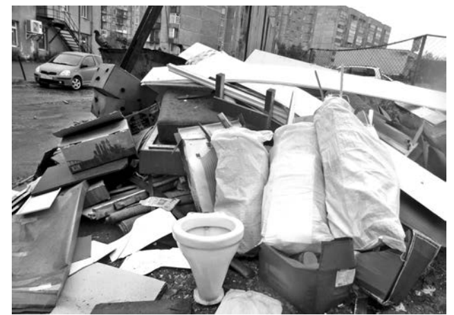
Унитаз-«пенсионер» и прочий хлам более полумесяца «радовали» глаз жителей улицы.