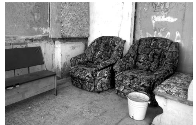
Вот такие уютные уличные места отдыха разбили у подъездов жители.

подъезде на Инженерной, 4, нам предлагали обменяться, даже с доплатой. Нет, куда я отсюда не поеду... Владимир Николаевич: Игорь ГЛУЦКИЙ.