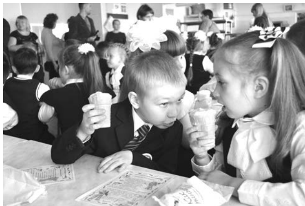
Сладкий сюрприз к Дню знаний - мороженое - похоже, станет традицией.

просторам знаний. Пожелаем им новых открытий, хороших оценок и крепкой дружбы, ведь школь-