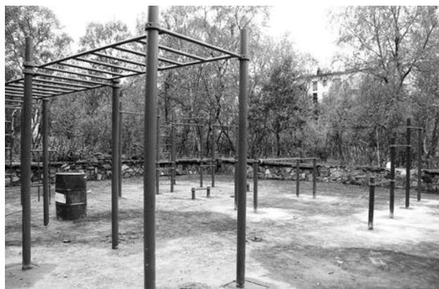
Уже через неделю поклонники комплекса ГТО и любители физкультуры смогут опробовать новую площадку в городском парке.

- Длина аллеи чуть более километра, в настоящее время отсыпали половину. При этом вторая сторона менее проблематична, думаю, что засыпем ее быстро и так же быстро заасфальтируем. Уверю, что это не проблема,