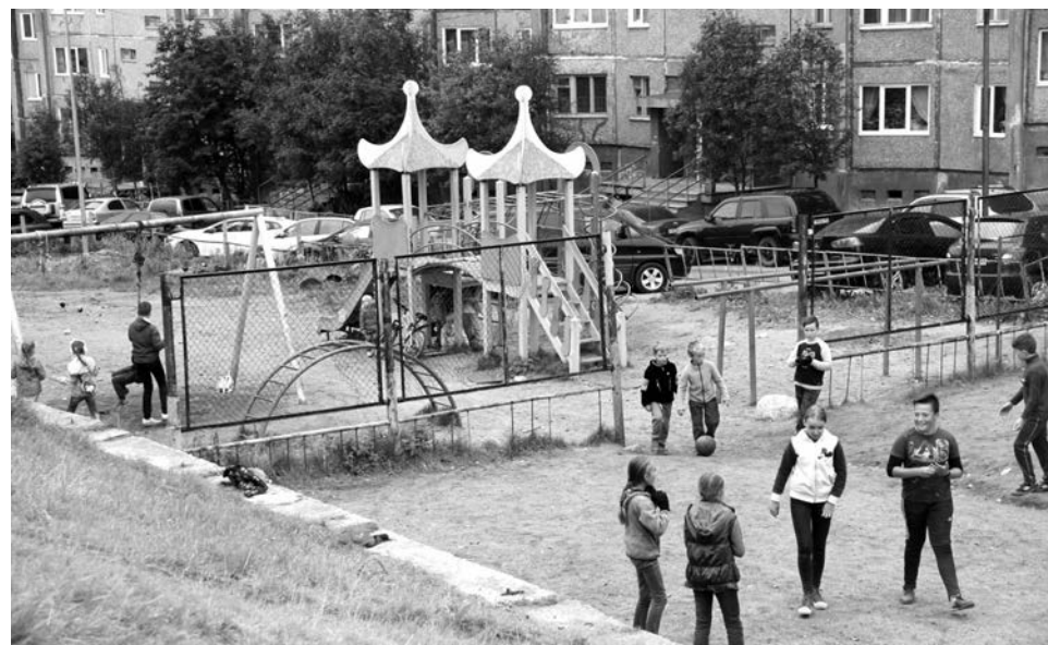
Детская и спортивная площадки по ул.Инженерной, 11-12, не в силах вместить всех детей, да и в обновлении давно нуждаются.