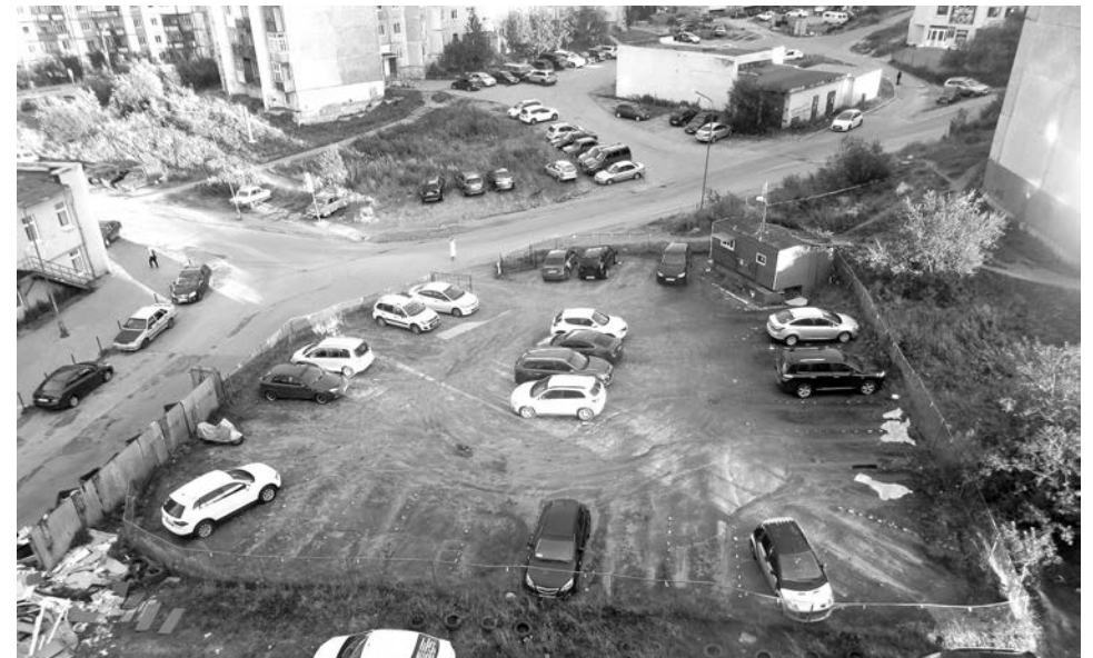
Единственная на Инженерной автостоянка всегда полупустая. Почему? Цены кусаются.