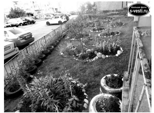
Один из редких благоустроенных двориков.

На крохотность детской площадки, выбоины на въезде на Инженерную, поборы на счетчики со стороны УК пожаловался военный пенсионер Константин, проживающий с 2005г. на Инженерной, 1, добавил: «Порядка не хватает». На неухоженность территории и падающие с горки на дорогу камни посетовала жительница дома №5 Светлана Ивановна. Напротив, остался чрезвычайно довольным выполненным в