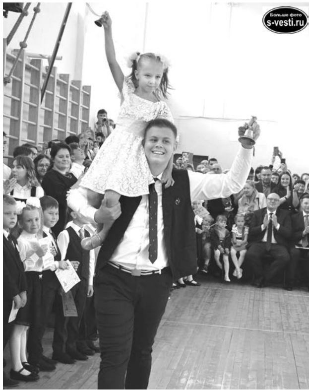
В этом году первый звонок прозвенел в СШ №12 в 47-й раз.

Впереди школяры ждут 34 недели увлекательного путешествия по