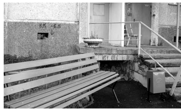
По просьбе жильцов у дома по ул. Инженерной, 12, появилась скамейка и урна.