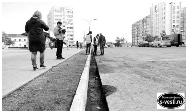
Бордюрный камень на Сев.Заставе появился - будет и асфальт.

Во дворе дома по ул. Инженерной, 12, по программе «Формирование комфортной городской среды» были установлены три опоры освещения, появилось новое асфальтовое покрытие