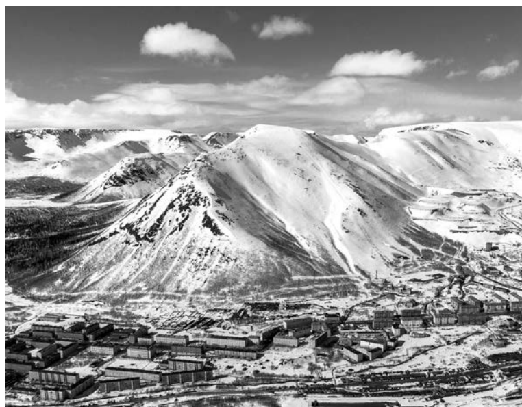
У любителей горных лыж название Кукисвумчорр отскакивает от зубов.

Отдохнул бы неплохо, если бы не нахлывид – маленькие существа, обитающие в лесах и на скалах, которые, согласно саамскому эпосу, щекочут людей и передразнивают их своим детским говорком. Но по сравнению с тем, что испытывали древние, назвавшие залив «Гандвиком», то есть заливом чудовищ, это просто забава. Впрочем, иные в «Гандвике» видят слово «норманн» (древний скандинав), из «Гандвик» и «лахти» выводят «Канда-