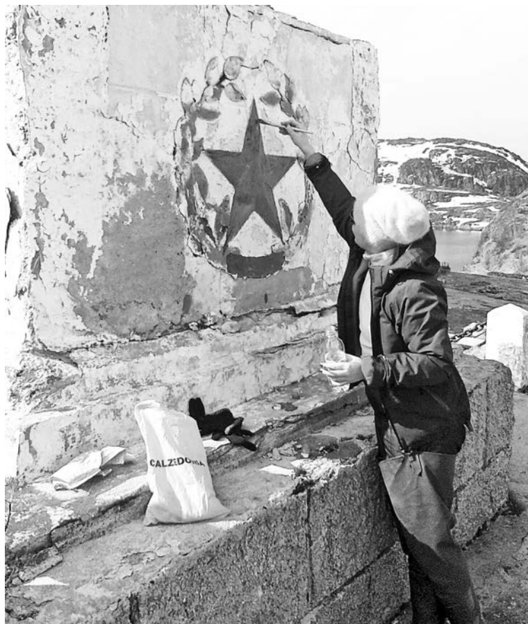
Благодаря таким энтузиастам, как члены клуба «Сариола», памятники героям Великой Отечественной, затерянные в отдаленных уголках Кольского полуострова, сохраняют достойный вид.

Наталья АВРАМУК.