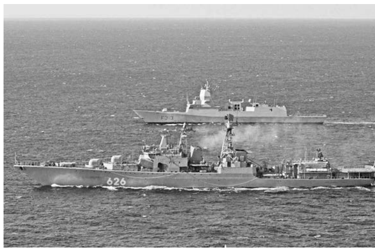
Во 2-й раз стали участниками «Помора» BPK «Вице-адмирал Кулаков» и норвежский фрегат «Хельге Инстад».

вители военно-морского командования двух стран, основная цель учения - отработка оперативной совместимости между военно-морскими и военно-воздушными силами - была успешно достигнута. Начальник штаба Западного военного округа генерал-лейтенант Андрей Картаполов высказал пожелание расширить сотрудничество и в следующем году отработать ликвидацию кризисных ситуаций на море уже в составе разнородных группиро-