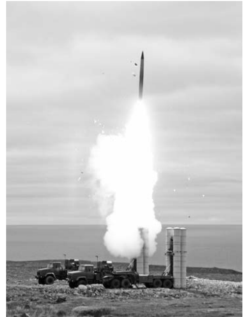
Учения с боевой стрельбой – вершина, итог всей боевой учебы и главный показатель ее эффективности.

– Зенитно-ракетный дивизион из Оленегорска со своим вооружением был доставлен на остров Кильдин, где