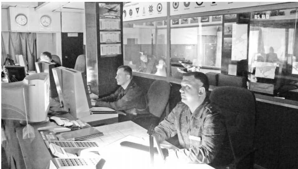
На командном пункте бригады боевой расчет несет круглосуточное дежурство.

В этом году основным мероприятием боевой подготовки для воинов ВКО станет оперативно-стратегическое учение «Запад-2013», в котором они будут участвовать совместно с силами Северного флота и другими родами войск. В летнем периоде обучения личный состав бригады продолжит совершенствовать воинское мастерство, чтобы и впредь надежно стоять на страже северных рубежей России.