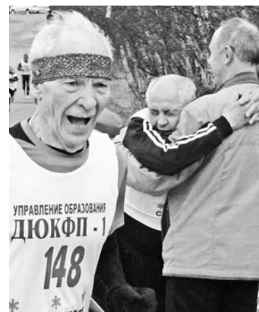
В столь почтенном возрасте каждый километр — большая победа.