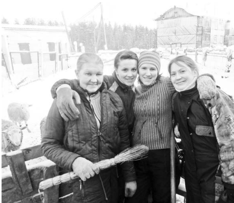
«Студентки» рады работать и на кухне, и в коровнике. Главное – они чувствуют себя полезными.

– Мой старший брат употреблял наркотики, и теперь его уже нет в живых. Я видела весь этот ужас и решила, что никогда не начну колоться, но зато стала травить себя алкоголем, считая, что это не так опасно, как пускать что-то себе по венам, – говорит