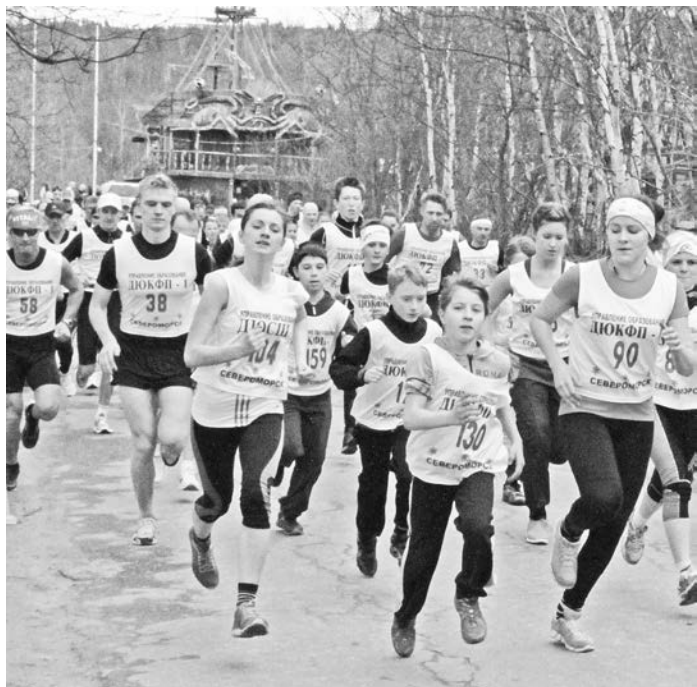
Эти соревнования объединили участников от 11 до 84 лет.

Уже много лет подряд здесь проходит чемпионат и первенство Мурманской области по