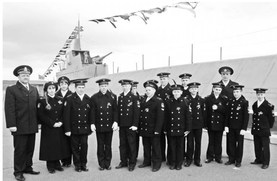
Фотографии на память после посещения музея ПЛ «К-21» бережно хранит не одно поколение военных моряков.

Полосу подготовила Ольга ВОРОБЬЕВА.