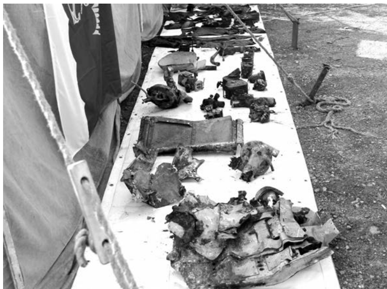
Большинство деталей Пе-2 прекрасно сохранились, они станут частью композиции воссозданного самолета.