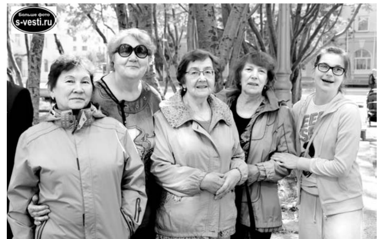
Гостям у нас понравилось, североморцам в Мончегорске - тоже.

Москва, Санкт-Петербург, Псков, Новгород, Ярославль, Углич, Кострома - участники Мурманского регионального отделения Всероссийского общества слепых объездили за несколько месяцев почти всю европейскую часть России и Кольский Север в частности.