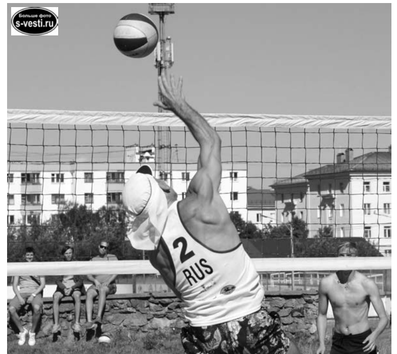
Атакуют команда из поселка Видяево.