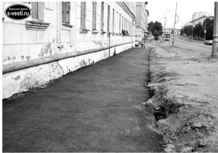
Благодаря активности жильцов дома №4 по ул. Кирова тротуар теперь удобен для пешеходов.

фальтированию и по адресам: ул. Гаджиева, 2, и ул. Инженерная, 12, также вошедшим в программу.