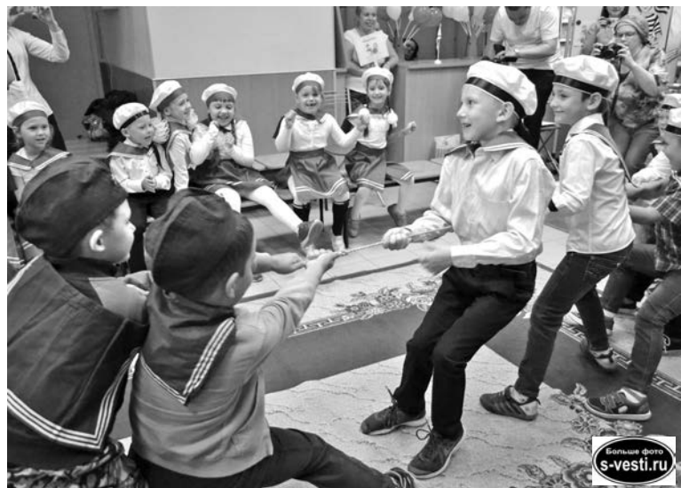
Команды мальчишек оказались одинаково сильными.